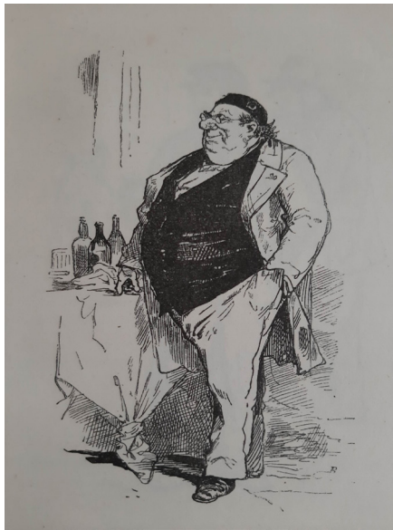
« Illustration d'un gourmand "Le rouge" », Bertall, 1878, La Vigne, voyage autour des vins de France. Étude physiologique, anecdotique, humoristique et même scientifique , Paris, E. Plon & Cie, p. 27.