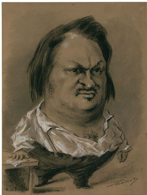
Félix Nadar, « Honoré de Balzac : caricature, en pied, la main posée sur une table », 1853.