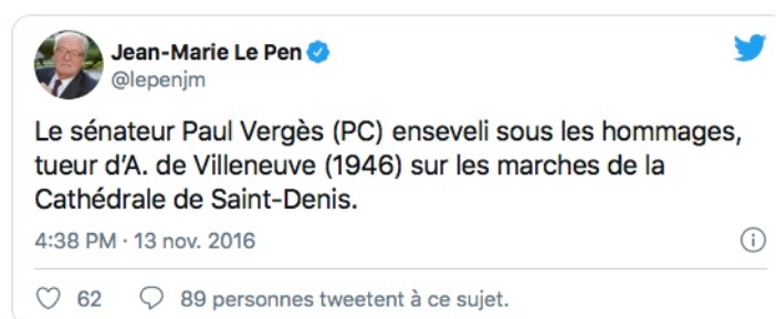
Figure 1. Tweet de Jean-Marie Le Pen publié le 13 novembre 2016, au lendemain du décès de Paul Vergès.

anciens et ancrés profondément dans la sphère médiatico-politique locale resurgissent sur la Toile. Plusieurs internautes se manifestent alors dans des commentaires anonymes, parfois particulièrement virulents et incitant à la haine. Sur les réseaux sociaux numériques (RSN), toujours au moment de la disparition de P. Vergès, les mêmes propos atrabilaires débordent de l'espace public médiatique strictement local, comme dans ce tweet de Jean-Marie Le Pen, président d'honneur du Front national et député européen qui exprime péremptoirement sa certitude de la culpabilité de P. Vergès :