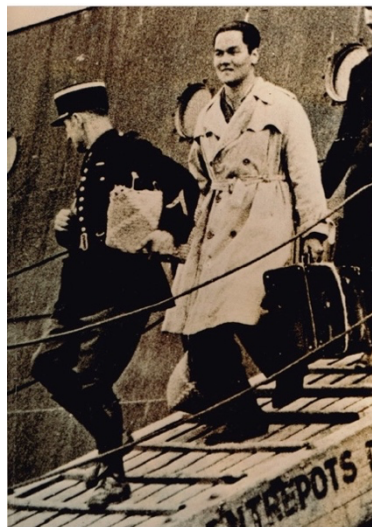
Photographie 2. Paul Vergès débarquant à Marseille le 5 mars 1947 (jour de ses 22 ans) pour son procès qui s'ouvrira le 28 juillet devant la cour d'assises du Rhône, à Lyon.