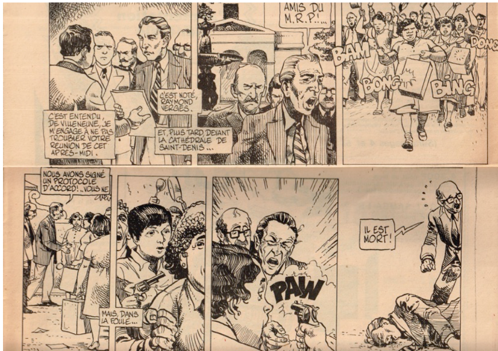
Illustration 2. Le numéro 19 (mai 1982, p. 3-4) de 97-4 Ouest se positionne radicalement dans l'énigme et représente, dans le dessin publié, un personnage sous les traits de Paul Vergès. Toutefois, la main qui tire reste ici aussi anonyme.