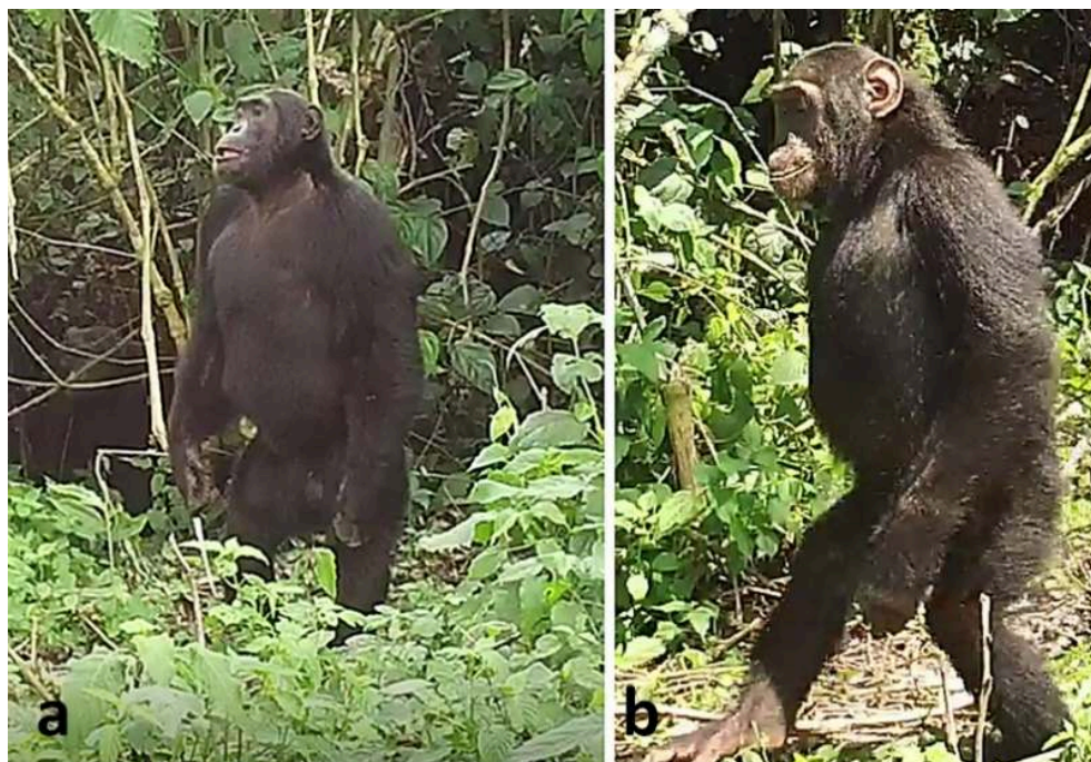
(A) posture bipède non assistée adoptée par un mâle adulte dans un contexte de vigilance en lisière de forêt ; (B) locomotion bipède non assistée adoptée par une femelle enfant dans un contexte de vigilance en lisière de forêt