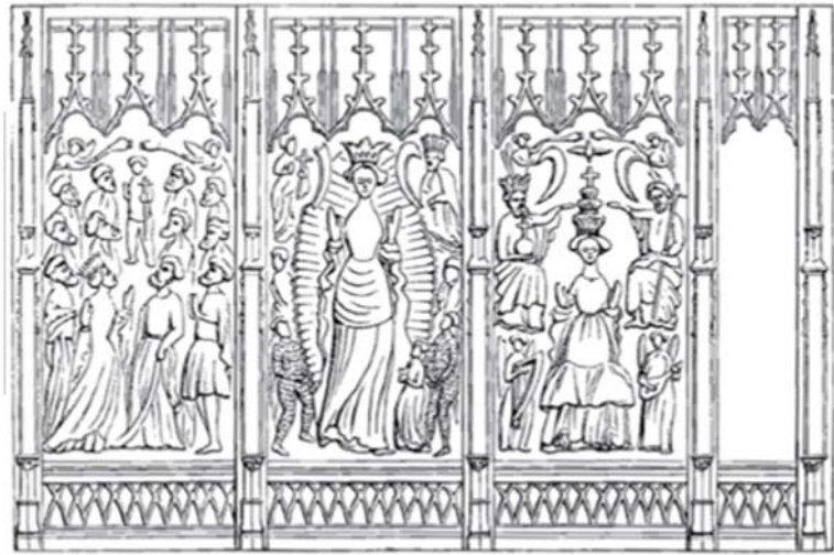
9- Détails de l'autel Saint-Joseph, à Saint-Michel de Bordeaux;