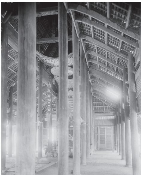
Fig. 24. Stung Trang, Kratie, Vat Chrui Ampil, bas-côté, 1929 [MNC 141.2]