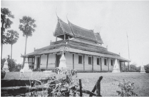
Fig. 9. Stung Sreng, Vat Ampil, 1930 [MNC 102.2]