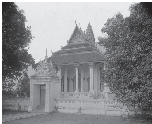
Fig. 2. Battambang, Vat Damrei Sa, portail et vihāra, 1924 [MNC 76.1]