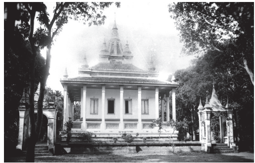
Fig. 10. Kompong Cham, Srei Santhor, Vat Di Baram, 1929 [MNC 66.8]