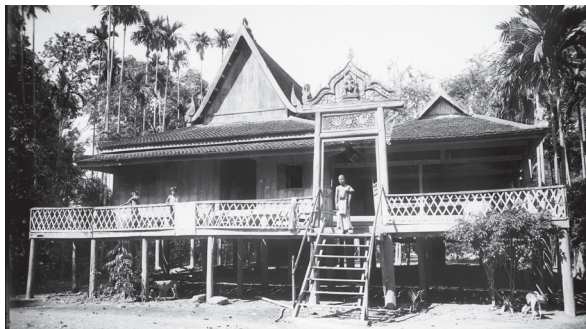
Fig. 32. Kompong Cham, Kang Meas, Vat Thlok Brouk, 1929 [MNC 66.7]