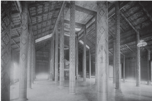
Fig. 25. Sithor Kandal, Prei Vèng, Vat Moha Léap, laque et or sur les colonnes, 1929 [MNC 140.4]