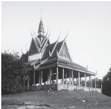
Fig. 16. Entre Babaur et Krakor, Vat Prah En Tep, sālā, 1930 [MNC 89.12]