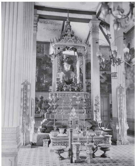
Fig. 21. Battambang, Vat Damrei Sa, statue du Buddha [s. d.] [MNC 20.18]