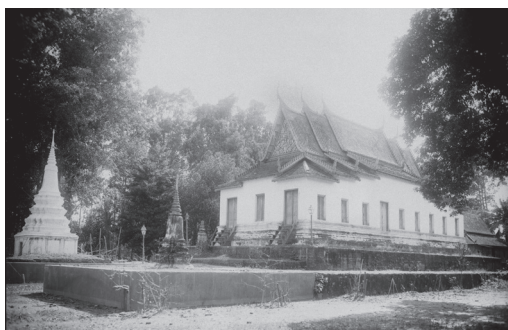
Fig. 7. Khsach, Kandal, Vat Kabal Kas Chas, vue de l'Est, 1929 [MNC 89.7]