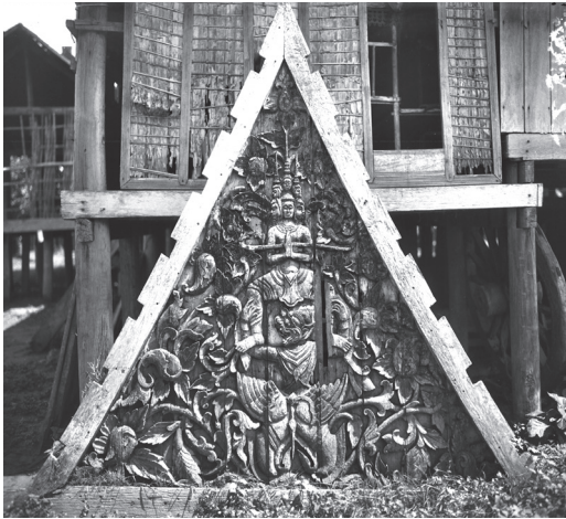
Fig. 17. Vat Chikreng, fronton déposé, bois sculpté [s. d.] [MNC 20.7]