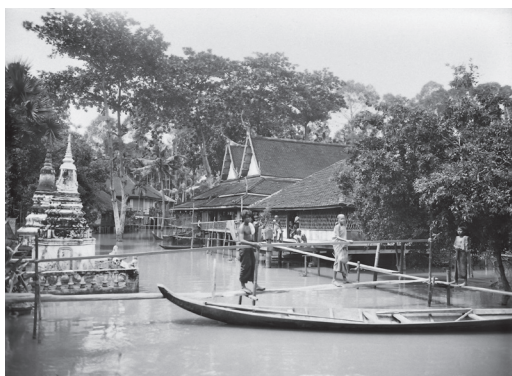
Fig. 34. Vat Lovea Sa. Vue générale des cellules des moines, Lovea Em, Kandal, 1929 [MNC 89.2]