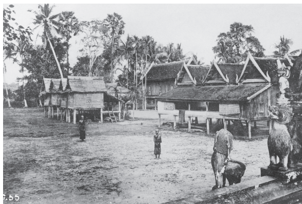
Fig. 33. Siem Reap, monastère non identifié, 1902 [MNC 150.9]