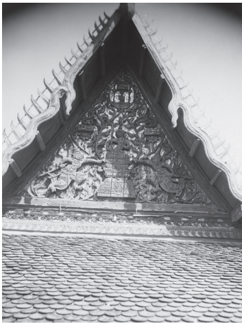
Fig. 18. Vat Sang Va, fronton du vihāra, 1929 [MNC 141.1]