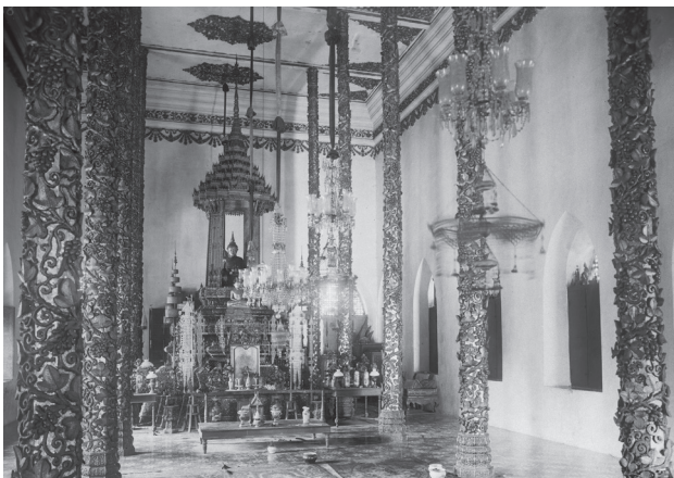
Fig. 28. Battambang, Vat Damrei Sa, 1924 [MNC 76.4]