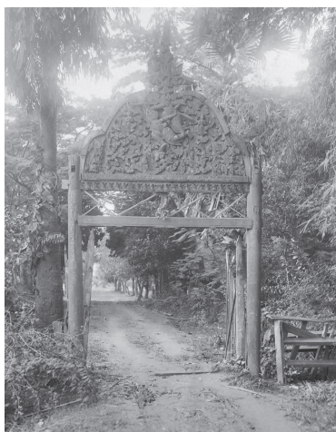
Fig. 1. Vat Mean Dap, portail du monastère, 1929 [MNC 66.2]