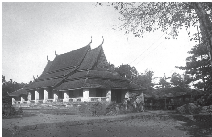
Fig. 13. Phnom Penh, Vat Saravan, vihāra, 1920 [MNC 27.3]