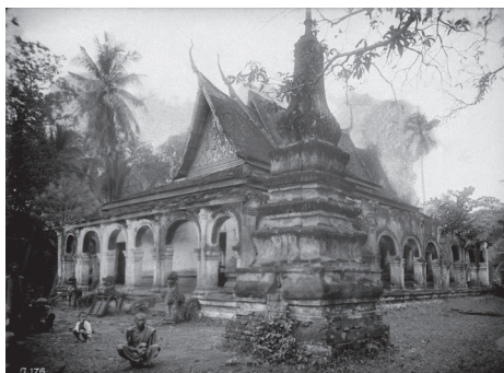
Fig. 8. Stung Chikrèng, Vat Anlong Sramnor, 1930 [MNC 102.6]