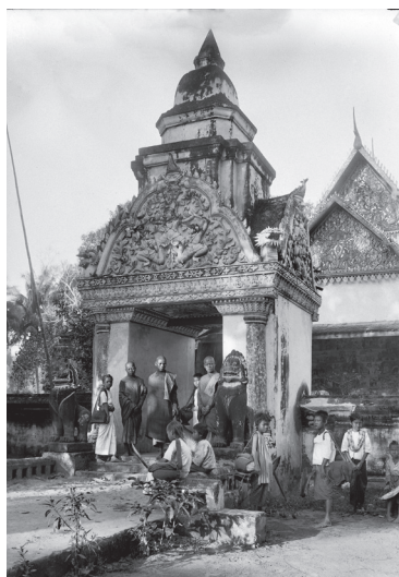
Fig. 4. Siem Reap, portail d'un monastère non identifié, 1902 [MNC 38.3]