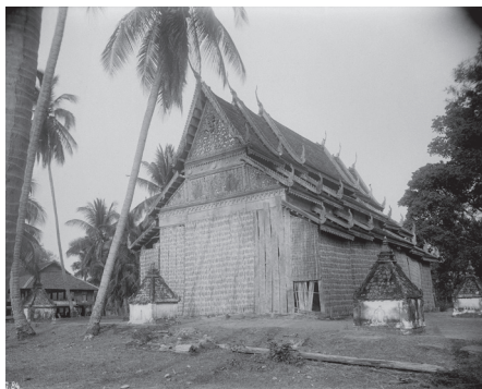
Fig. 14. Battambang, Phom Srok, Vat Savan Lakkha Sattrā Aram, 1924 [MNC 76.2]