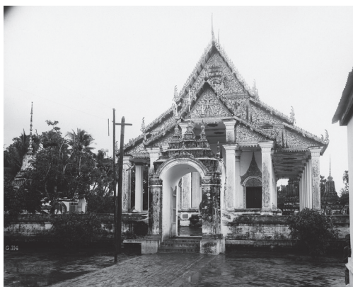
Fig. 3. Battambang, Vat Sangke, portail et vihāra, 1929 [MNC 89.16]