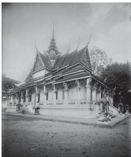
Fig. 15. Kompong Chhnang, Vat Yeai-Tep, vihāra, 1929 [MNC 89.11]