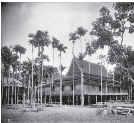
Fig. 29. Khsach Kandal, Vat Prèk Krabau, 1929 [MNC 89.5]