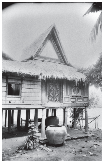
Fig. 35. Srei Santhor, Vat Roka Thvear ou Prek Pol, 1929 [MNC 66.5]