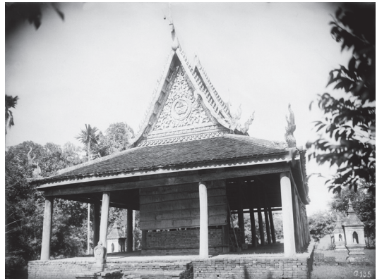
Fig. 20. Kompong Cham, Srei Santhor, Vat Kas Chen, 1929 [MNC 66.10]