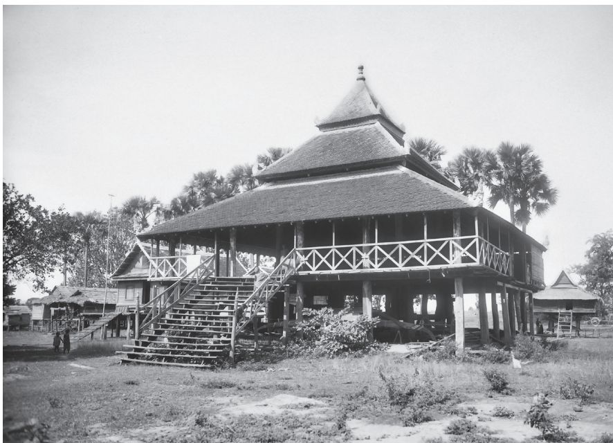
Fig. 31. Pursat, Vat Pech Sdei, 1929 [MNC 89.14]