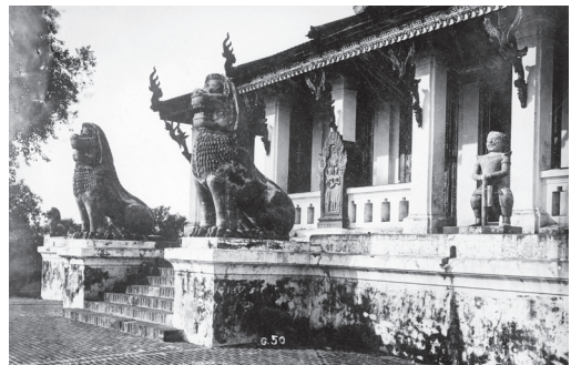
Fig. 12. Phnom Penh, Vat Phnom, 1902 [MNC 150.6]