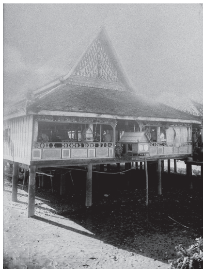
Fig. 30. Sithor Kandal, Prey Veng, Vat Ta Prey, 1929 [MNC 66.11]