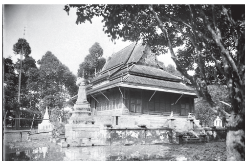
Fig. 6. Kien Svai, Kandal, Vat Chruï Ampil, vue de l'Ouest, 1929 [MNC 89.4]