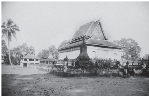
Fig. 5. Sithor, Kandal, Prey Veng, Vat Ansey Kong, vue de l'Est, 1929 [MNC 66.14]