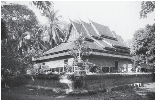
Fig. 11. Kompong Cham, Thbong Khmum, Vat Pos, 1929 [MNC 107.6]