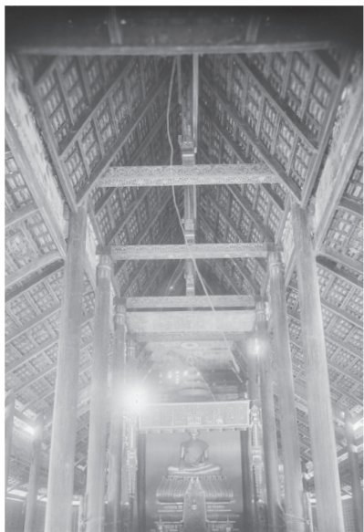
Fig. 23. Kompong Cham, Thbong Khmum, Vat Chamcar Mlu, nef centrale, 1929 [MNC 191.7]