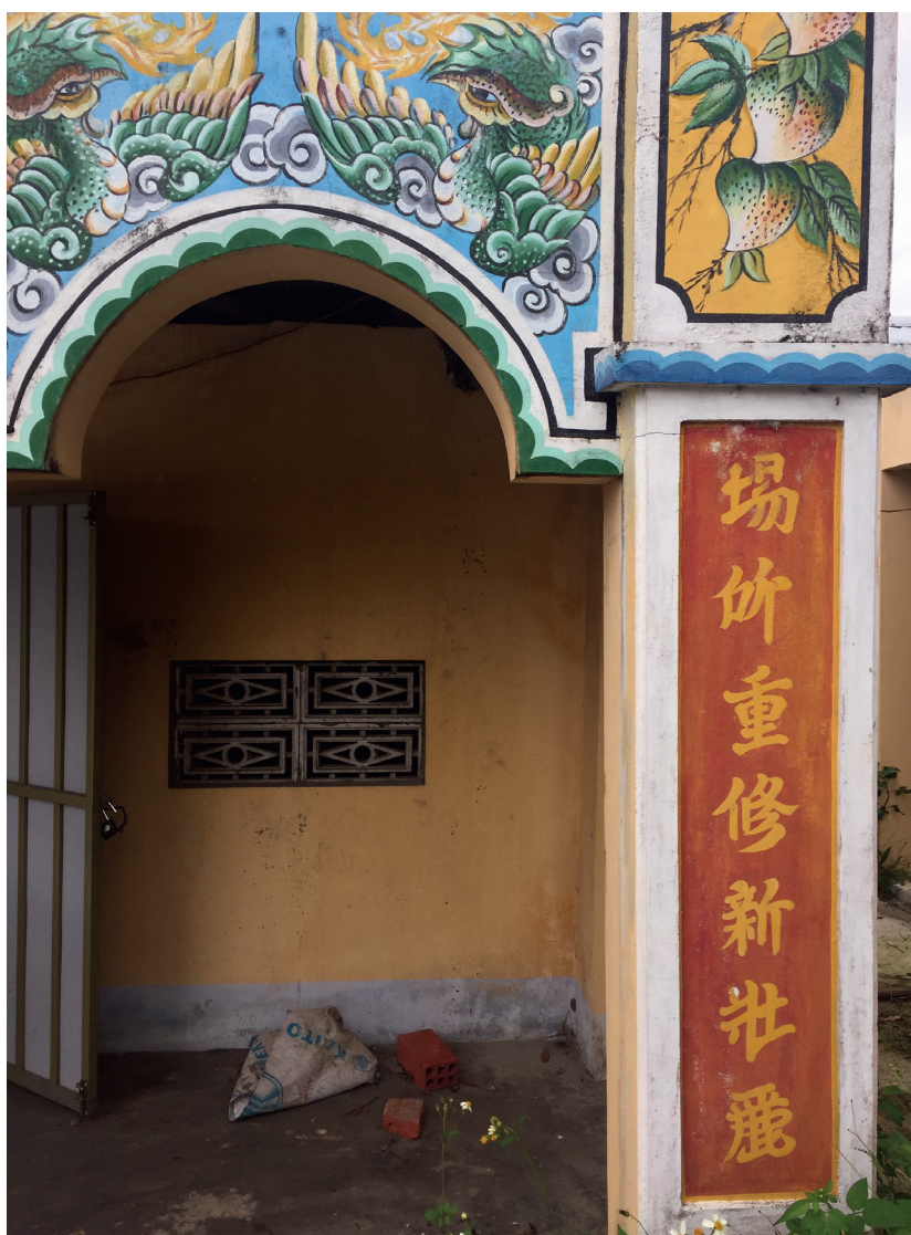
Fig. 5 — Inscription sur la colonne droite de la façade du đình d’An Khê.

1988, p. 19) une note dans la géographie officielle des Nguyễn (Cao Xuân Dục 1964, p. 58). Celle-ci le situe de manière très précise. Mais la note est d’une lecture difficile, car, rédigée à la fin du xix e siècle, elle résume avec une concision excessive tout un siècle de changements de noms et de lieux. De ces évolutions, la plus difficile est celle du toponyme An Khê. Au début de la note, An Khê désigne un site sur la rive occidentale : le « lieu-dit Chợ Đồn ». Plus loin, l’auteur localise An Khê sur la rive orientale : sur le site de « l’ancien campement des Tây Sơn » (c’est-à-dire à An Lũy). C’est seulement quand le lecteur a compris que ce nom désigne deux lieux à deux époques différentes qu’il saisit le sens de la note, à savoir qu’en 1829 le marché d’An Khê (= Chợ Đồn) a été déplacé à An Khê (= An Lũy) :