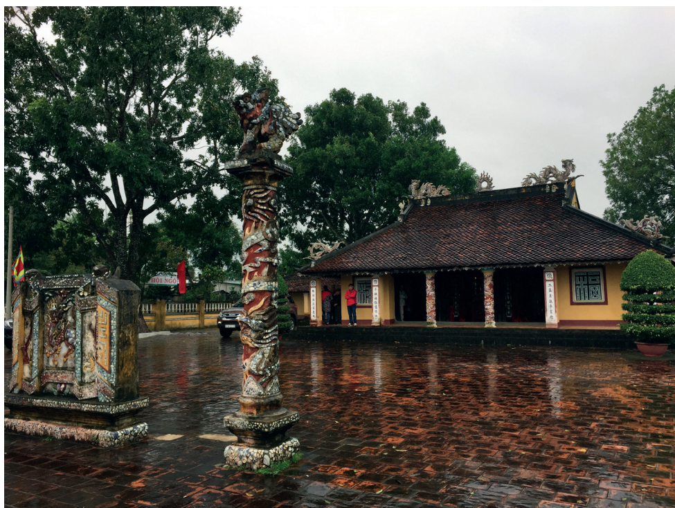
Fig. 3 — Le temple An Khê Trường (quartier d'An Lũy, ville d'An Khê, province de Gia Lai). Photographie : EFEO, 2017.