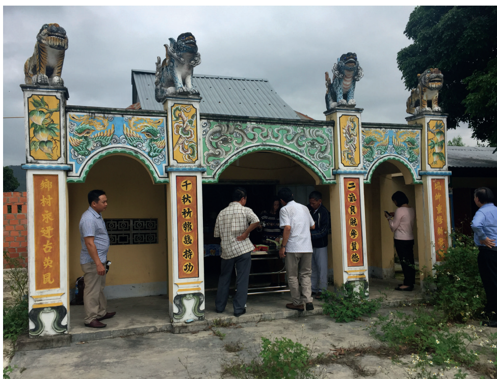
Fig. 4 — Le đình d'An Cu (quartier de Chợ Đồn, ville d'An Khê). Photographie : EFEO, 2018.

au xx e siècle, il est décoré de fragments de bols céramiques datant du xviii e siècle. Ici et sur les terrains situés au nord et à l'est du temple, on trouve des quantités de matériel en brique, en céramique et en pierre (latérite) : les archéologues estiment que ces fragments datent des xviii e -xx e siècles, voire même de l'époque du Champa (xv e siècle). Il s'agit d'un lieu d'occupation humaine très ancienne.