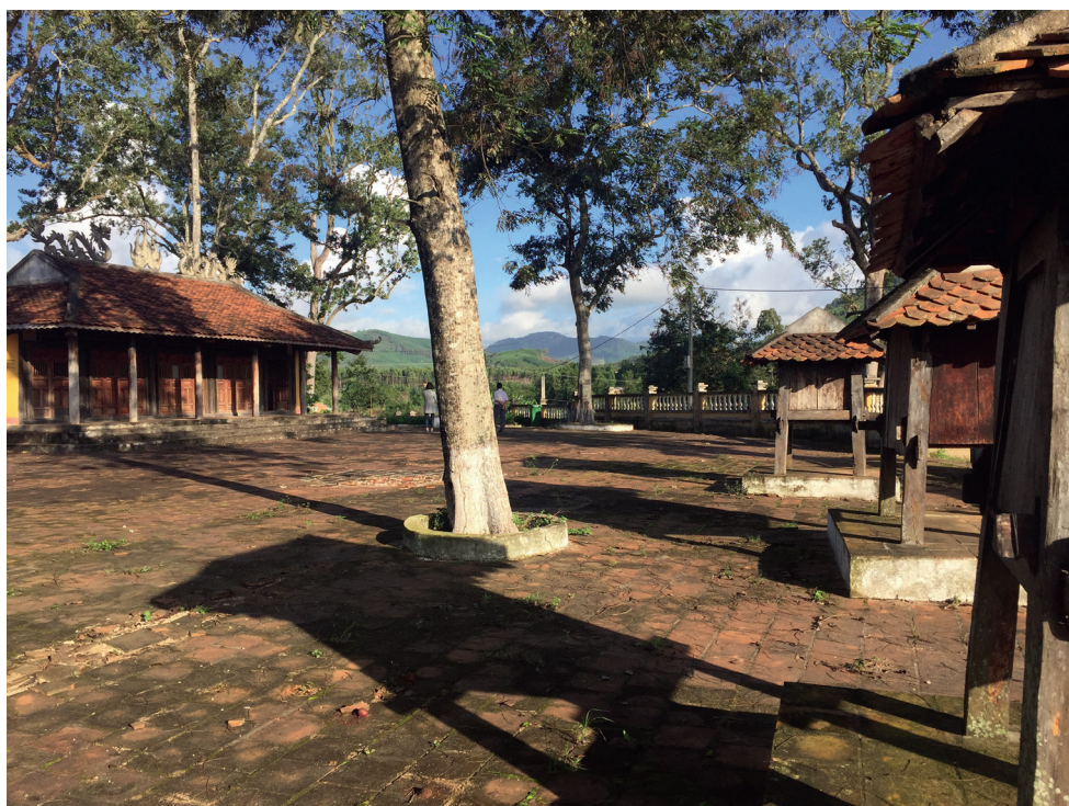
Fig. 2 — Le temple An Khê Đình (quartier d'An Lũy, ville d'An Khê, province de Gia Lai), avec ses trois sanctuaires. Photographie : EFEO, 2018.