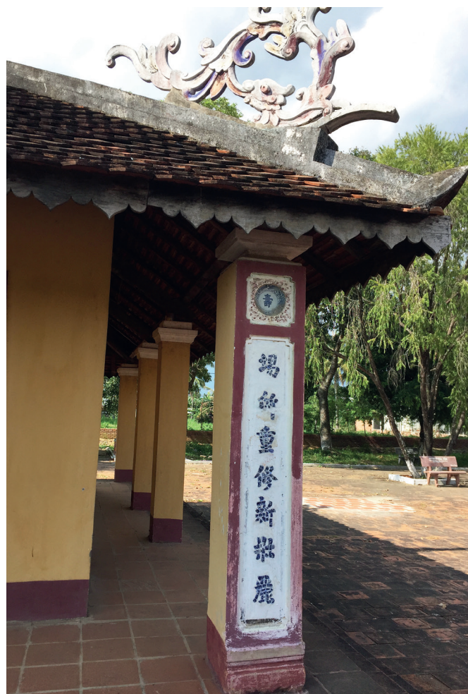
Fig. 6 — Inscription sur la colonne droite de la façade du temple An Khê Trường.