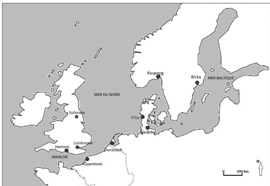
Emporia d'Europe du Nord-Ouest (VII e -XI e siècle) cités dans le texte.

marqué par une indéniable hétérogénéité ethnique, ce que l'archéologie a largement confirmé : la grande diversité ethnique du groupe des marchands aux IX e et X e siècles transparaît bien dans leurs pratiques funéraires et même parfois à travers des types spécifiques de maisons ou des éléments traditionnels de leur costume 14 .