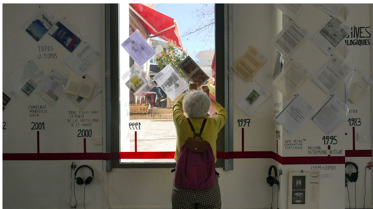
Hôtel du Nord: biennale Manifesta, Marseille 2020.

Le maintien en vie d'archives et du patrimoine plus généralement, est au coeur des processus Faro qui cherchent à maintenir vivant et en vie des patrimoines pour qu'ils ne soient pas simplement conservés, voir muséifiés. A Venise l'association Faro Venezia organise des balades patrimoniales sur les récits invisibles à destination des vénitiens, responsables politiques et institutionnels pour qu'ils enrichissent leur imaginaire de la ville et puissent penser son avenir. L'expérience Faro mené à l'Arsenal de Venise s'est confrontée à la force du récit touristique dominant où l'Arsenal de Venise n'est raconté que comme antique, oubliant l'Arsenal industriel et moderne. Il influence fortement la capacité des habitants à penser le futur de leur ville. Des photos des hydravions, sous-marins et navires en acier construits dans l'Arsenal sont venues rappeler sa riche histoire industrielle. A Marseille les communautés racontent « Marseille par son nord » pour changer la perception de ses quartiers nord en pleine reconversion industrielle et où la carte semble blanche pour ceux qui pensent leur avenir. Les associations de la FAMDT contribuent à la conservation des chansons et danses par leur constante re interprétation et actualisation.