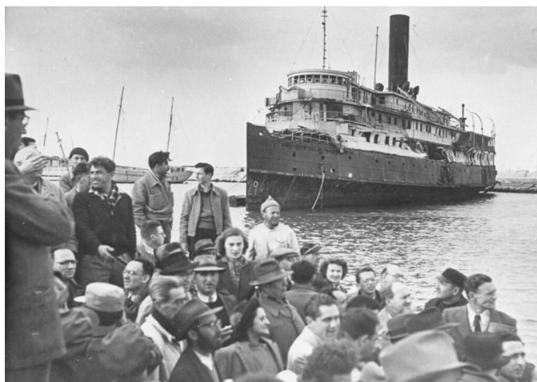
Immigration to Israël, 1947

Le projet Lubartworld combine une approche historique transnationale et une méthodologie microhistorienne, puisque son objectif consiste à reconstruire, une par une, la totalité des trajectoires individuelles des habitants juifs de la petite ville polonaise de Lubartów du début des années 1920 aux années 1950, qu'ils aient émigré ou qu'ils soient restés sur place, qu'ils aient été exterminés ou qu'ils aient survécu à la Shoah.