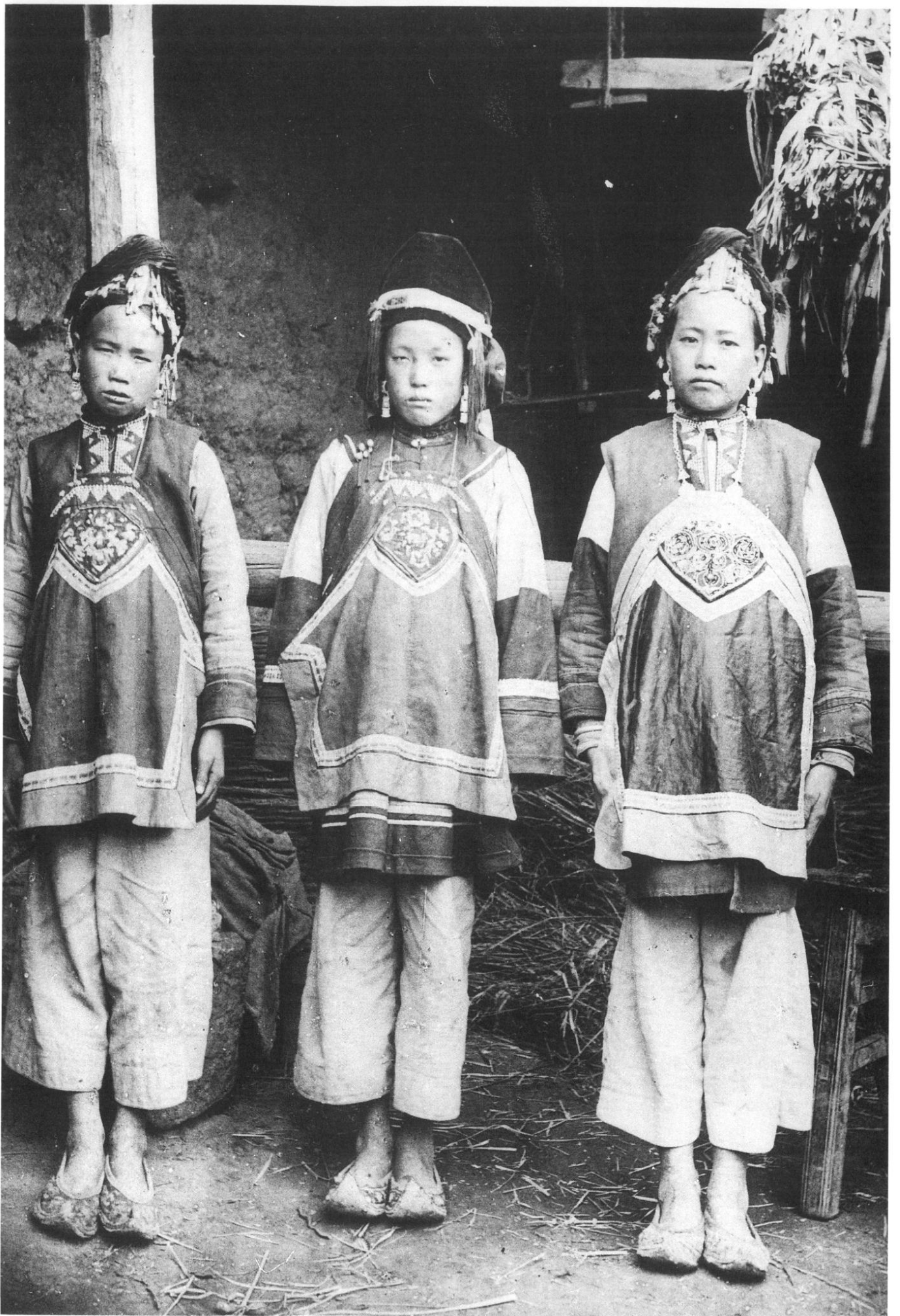
Chine. Enfants de la province du Yunnan. (Ph. MH).