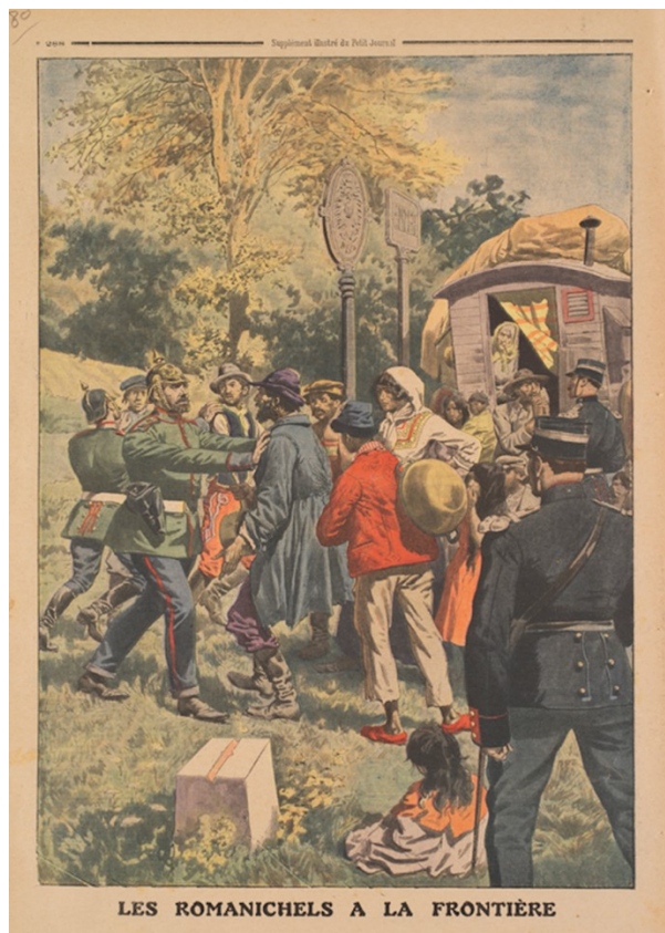
« Les Romanichels à la frontière », Le Petit Journal , supplément illustré, 8 septembre 1912.