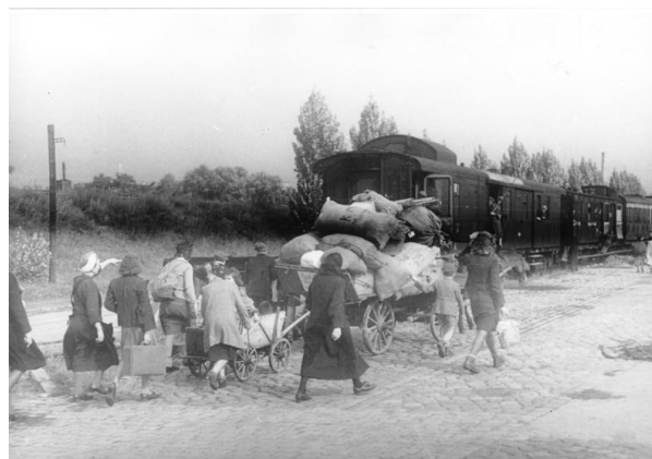
Expulsion d'Allemands, 1946.