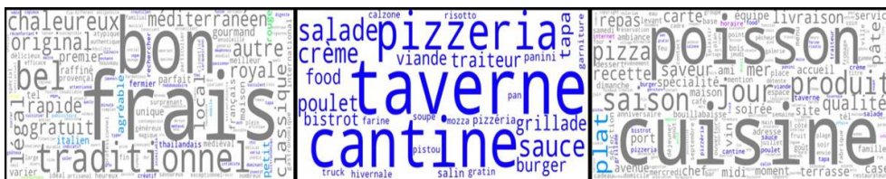
Figure 2. Lexiques extraits de la classe « restauration » de notre typologie.

De gauche à droite : 2.a : Ensemble des lemmes (noms, adjectifs, verbes) de cette classe. 2.b : ensemble des noms exclusifs à cette classe (les mots n'apparaissent dans aucune des autres classes de site). 2.c : Ensemble des noms de la classe restauration. En gris les mots communs (identifiés dans d'autres classes de site), les autres couleurs colorent les termes exclusifs des autres classes dans l'ensemble des schémas.