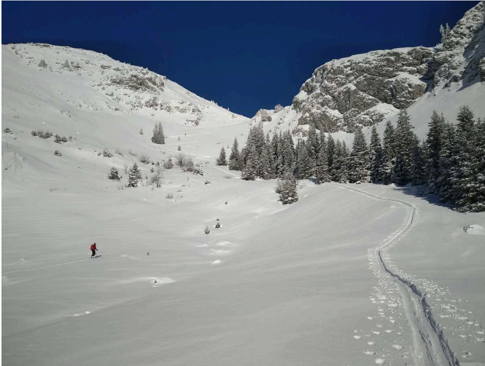
Figure 3. Une trace ascendante de ski de randonnée