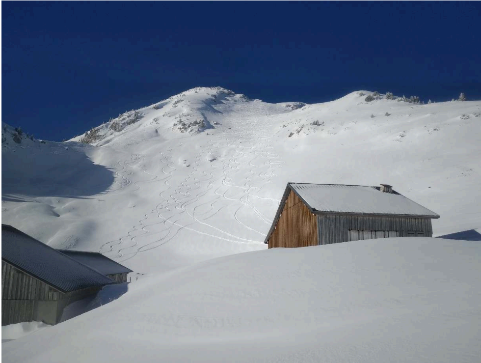
Figure 4. À l'arrière-plan, l'entrelacs de traces de ski de randonnée à la descente