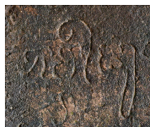
Fig. 1 — Le mot bhaviṣya : exemple paléographique d'une voyelle i brève descendant à droite, tiré de l'inscription K. 341-S (673 de n. è., l. 2).