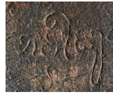
Fig. 1 — Le mot bhaviṣya : exemple paléographique d'une voyelle i brève descendant à droite, tiré de l'inscription K. 341-S (673 de n. è., l. 2).