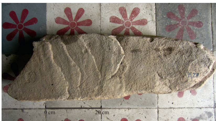
Fig. 3 — Photographie de l'arrière du support de l'inscription K. 1373.