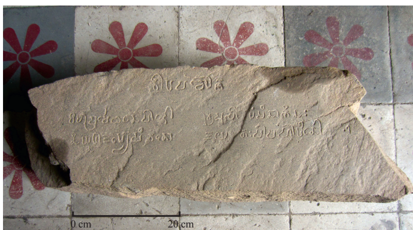
Fig. 2 — Photographie de l'inscription K. 1373.