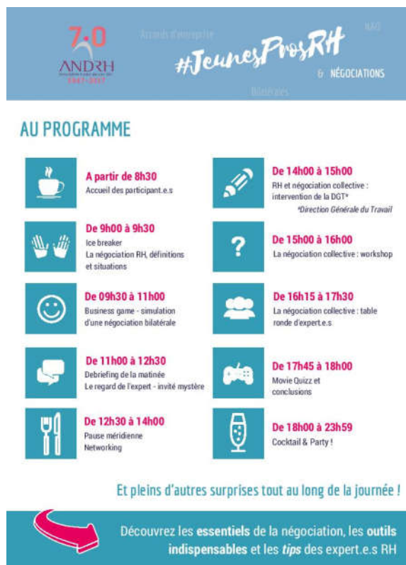
Figure n°1. Programme de la journée de formation « Jeunes Pros RH et négociations », juillet 2017