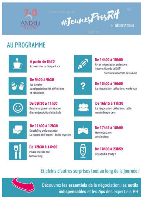
Figure n°1. Programme de la journée de formation « Jeunes Pros RH et négociations », juillet 2017