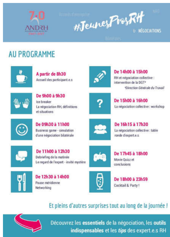
Figure n°1. Programme de la journée de formation « Jeunes Pros RH et négociations », juillet 2017