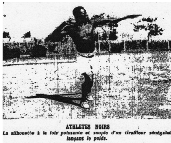
Figure 2 «Nous produire en public?», L'Auto , 5 janvier 1938, p. 8 (Frémont 1938b)

Si L'Auto – tout comme Paris-soir – dresse déjà de nombreux états des lieux des équipements sportifs nord-africains, il connaît peu la situation en A.O.F. Ainsi, il va pouvoir célébrer l'œuvre coloniale en cours en réalisant le premier bilan sportif en Afrique Noire et en martelant l'idée qu'il est indispensable d'y développer l'éducation physique (E.P.) et le sport. Avec de nombreuses focalisations sur les écoles, l'armée, les sociétés, les manifestations, les infrastructures sportives et l'évocation des instituts «pour former des médecins et des sages-femmes indigènes» (Frémont 1938a) au Sénégal et au Soudan, tout semble bon pour rappeler la souveraineté et la présence indispensable de la France en A.O.F., justifier la colonisation (et ainsi la «mission civilisatrice»), le travail accompli, les progrès déjà effectués par certains tirailleurs sénégalais et les espoirs sportifs placés en eux au contraire des «petits noirs sur le stade» (Frémont 1937e). «La colonie est en marche» paraît sous-entendre chaque article. Cependant, constatant qu'il leur sera impossible de trouver le grand champion noir tant attendu, les missionnaires vont progressivement s'attacher exclusivement à soutenir le développement et l'organisation du sport scolaire, civil et militaire.