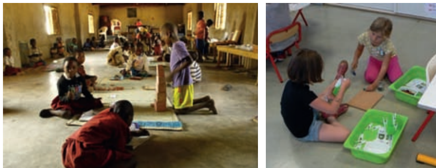
Figure 3. À gauche : un jardin d'enfants de la fondation The Olive branch for Children, Tanzanie (2017). À droite : une école maternelle publique française utilisant les « tiroirs Montessori » (2020).

Tanzanie, The Olive branch for Children (OBFC) scolarise 2 000 élèves dans ses 30 jardins d'enfants Montessori. À Haïti, la fondation Peter Hesse (FPH) a créé 54 écoles Montessori et formé 750 enseignant-e-s locaux-ales. Il s'agit majoritairement de jardins d'enfants (3-6 ans), plus rarement d'écoles élémentaires, destinées aux enfants les plus défavorisé-e-s : milieux ruraux isolés, orphelinats, enfants des rues. Le principe du travail autonome librement choisi par les enfants sur un matériel pédagogique est bien présent, mais les conditions matérielles sont adaptées à ce qui est permis par un budget réduit et des conditions locales parfois difficiles, comme le montre la figure 3.