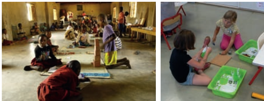
Figure 3. À gauche : un jardin d'enfants de la fondation The Olive branch for Children, Tanzanie (2017). À droite : une école maternelle publique française utilisant les « tiroirs Montessori » (2020).

Tanzanie, The Olive branch for Children (OBFC) scolarise 2 000 élèves dans ses 30 jardins d'enfants Montessori. À Haïti, la fondation Peter Hesse (FPH) a créé 54 écoles Montessori et formé 750 enseignant-e-s locaux-ales. Il s'agit majoritairement de jardins d'enfants (3-6 ans), plus rarement d'écoles élémentaires, destinées aux enfants les plus défavorisé-e-s : milieux ruraux isolés, orphelinats, enfants des rues. Le principe du travail autonome librement choisi par les enfants sur un matériel pédagogique est bien présent, mais les conditions matérielles sont adaptées à ce qui est permis par un budget réduit et des conditions locales parfois difficiles, comme le montre la figure 3.