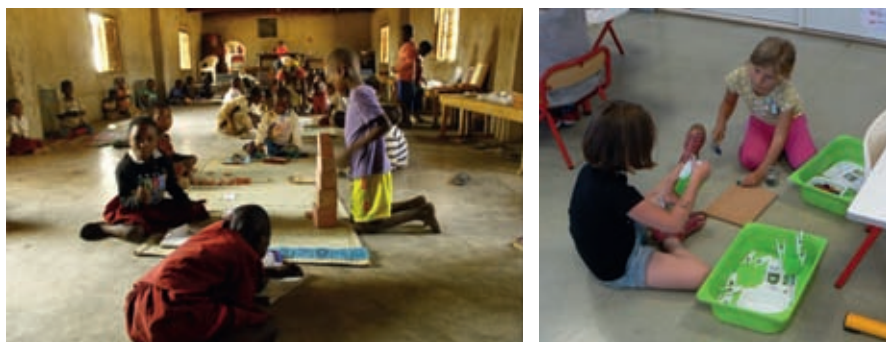
Figure 3. À gauche : un jardin d'enfants de la fondation The Olive branch for Children, Tanzanie (2017). À droite : une école maternelle publique française utilisant les « tiroirs Montessori » (2020).

Tanzanie, The Olive branch for Children (OBFC) scolarise 2 000 élèves dans ses 30 jardins d'enfants Montessori. À Haïti, la fondation Peter Hesse (FPH) a créé 54 écoles Montessori et formé 750 enseignant-e-s locaux-ales. Il s'agit majoritairement de jardins d'enfants (3-6 ans), plus rarement d'écoles élémentaires, destinées aux enfants les plus défavorisé-e-s : milieux ruraux isolés, orphelinats, enfants des rues. Le principe du travail autonome librement choisi par les enfants sur un matériel pédagogique est bien présent, mais les conditions matérielles sont adaptées à ce qui est permis par un budget réduit et des conditions locales parfois difficiles, comme le montre la figure 3.