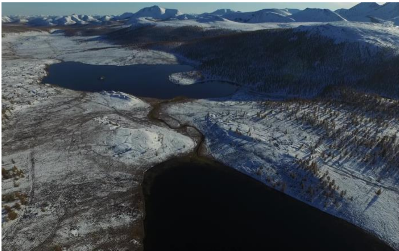
Рис. 1 – Термокарстовая озеро Булгунняхтах в горно-ледниковой долине. Аэрофотосъемка

Хребет Орулган является одним из самых труднодоступных мест Республики Саха (Якутия), выезды в летний период затруднены частыми паводками в горных реках при выпадении дождей. Ключевой участок исследования и полевых комплексных описаний типологических комплексов определен на восточном склоне хребта, где проведены полевые работы в осенний период 2018 г (сентябрь) и летний период 2019 (июль-август). Всего пройдено два маршрута в оба сезона.