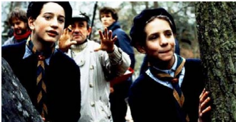
Louis Malle dirige ses deux jeunes interprètes