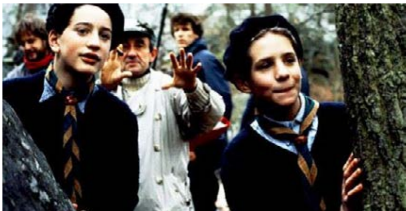
Louis Malle dirige ses deux jeunes interprètes