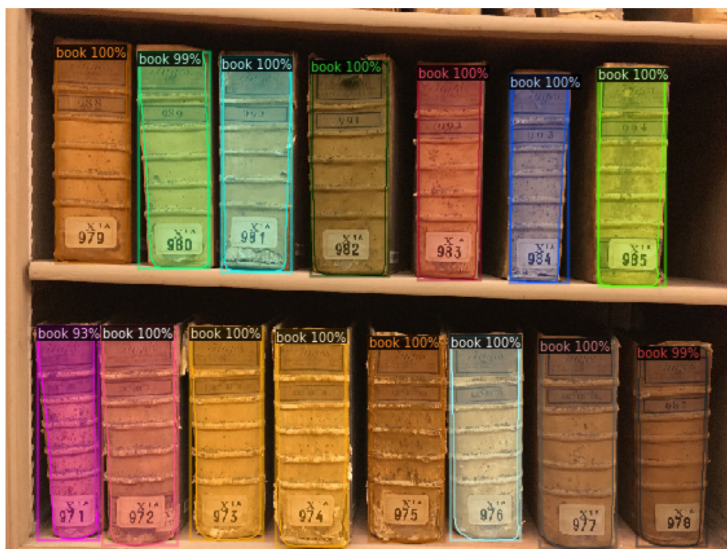
Figure 8 Registres détectés automatiquement sur leur étagère avec le réseau Mask RCNN.