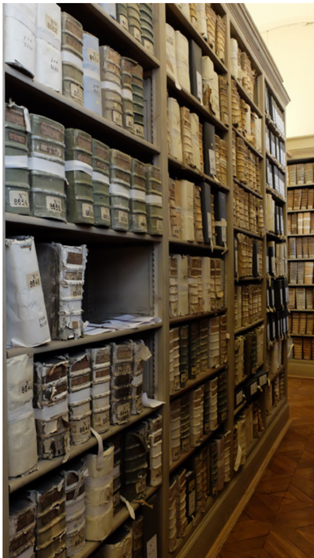
Figure 1 Une partie des réserves des registres du Parlement de Paris.

Pour ce projet de recherche, notre choix s'est porté sur la collection des archives du Parlement de Paris, qui est exceptionnelle par son histoire, son volume et son homogénéité. Le Parlement de Paris a été actif depuis le règne de Saint-Louis jusqu'à la Révolution française. Il a reçu des appels, au civil et au criminel, des juridictions ordinaires inférieures, et instruit directement les procès concernant les personnages les plus importants du royaume : roi, ducs et pairs (Hildesheimer, 2011).