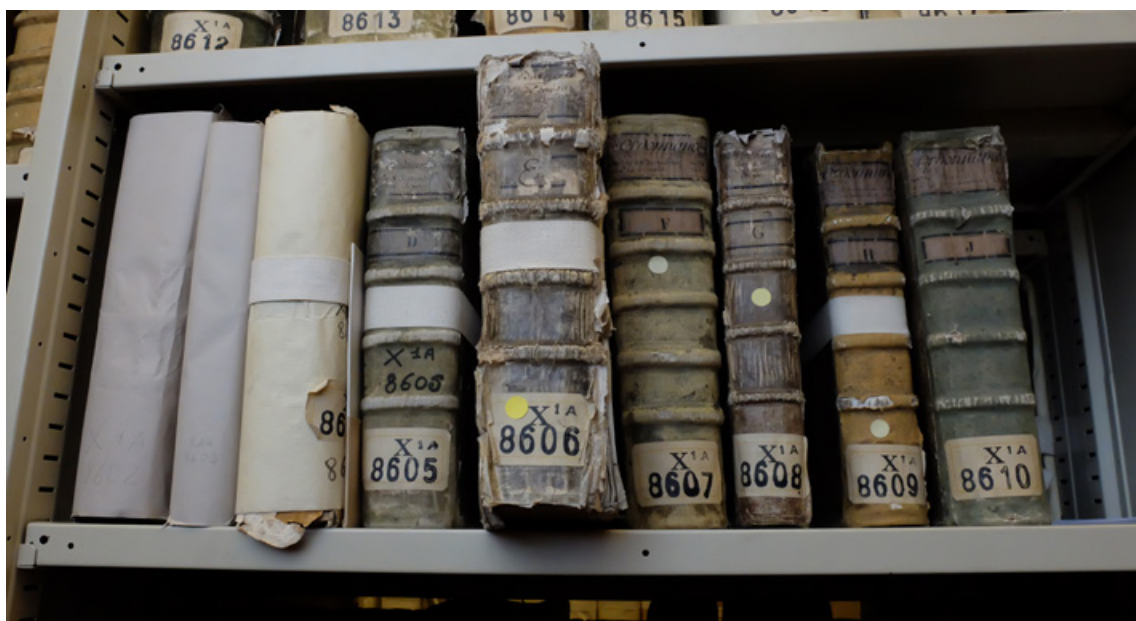
Figure 2 Registres du Parlement de Paris sur une étagère.

du Corail ainsi qu'avec monsieur Eric Laforest, chef de travaux d'art, restaurateur de documents graphiques et de livres aux Archives nationales, six classes d'altération ont été choisies :