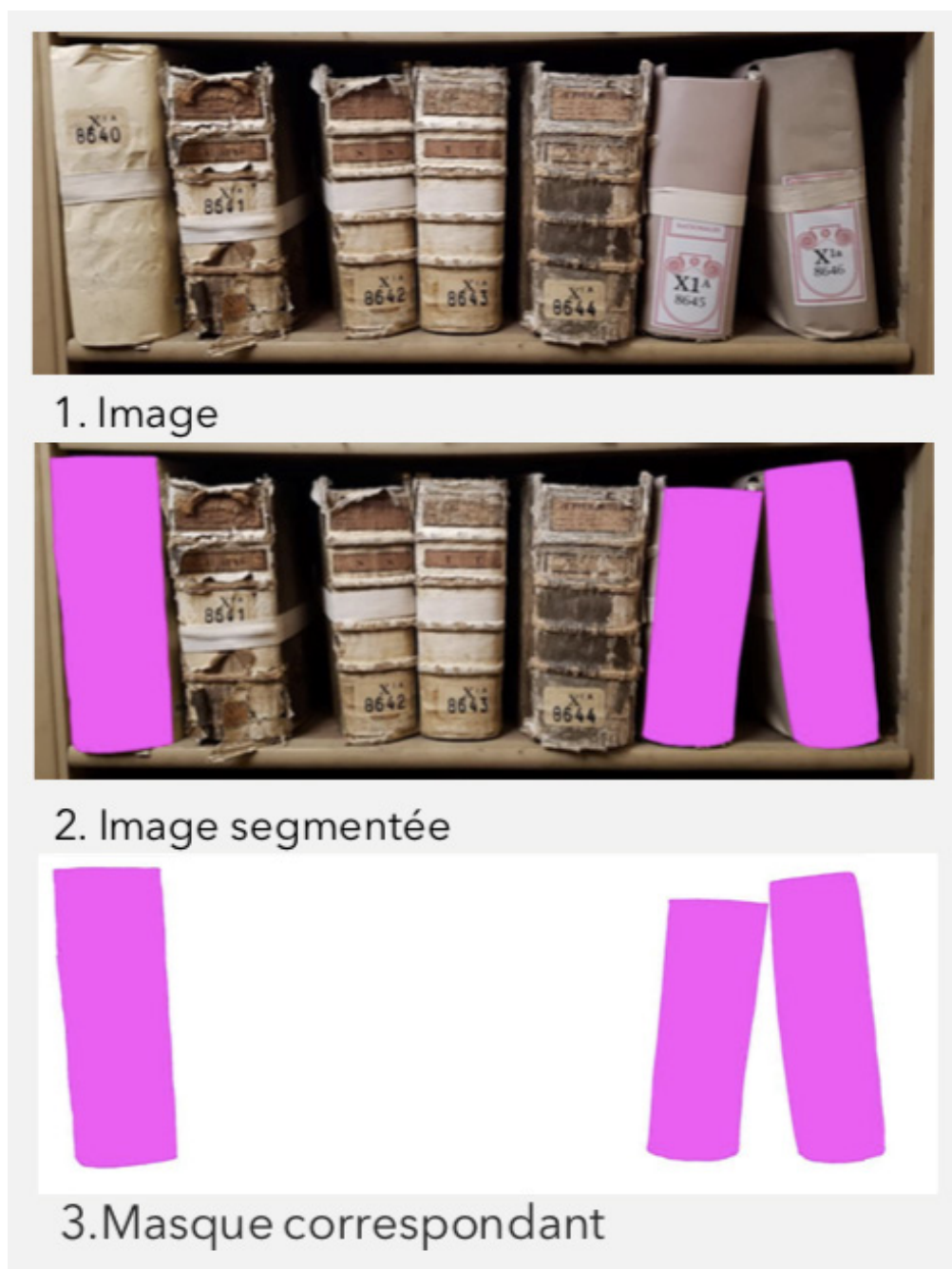
Figure 6 Segmentation des images de registres.

Pour notre recherche, des réseaux neuronaux généralistes ont été adaptés au contexte particulier des registres afin de réduire la complexité de l'apprentissage. Tout d'abord, une base de données de deux cents photographies comportant en tout mille deux cents registres sur leur étagère a été segmentée : les altérations dangereuses situées sur le dos des reliures ont été relevées directement sur les photographies par des traits ou des aplats de couleur avec le logiciel Adobe Photoshop® (fig. 6). Trois mille masques ont été créés. Le but de l'entraînement du réseau de neurones est d'obtenir automatiquement des masques signalant les surfaces altérées à partir de photographies non annotées. Ainsi, avec une base de données de mille deux cents registres annotés, les informations sur l'état de conservation des dix mille quatre cent cinquante-neuf registres restants seront générés automatiquement.