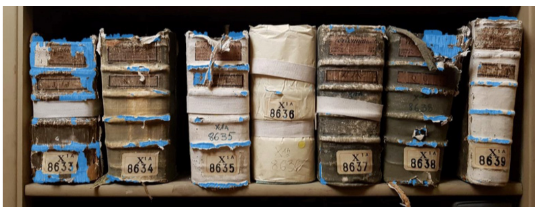
Figure 7 Zones de lacunes de cuir en bleu détectées automatiquement avec le réseau U-Net pré-entraîné.