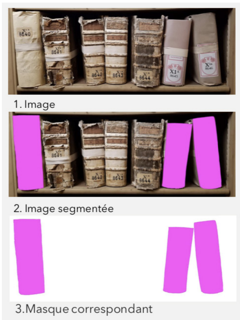
Figure 6 Segmentation des images de registres. © Valérie Lee.

Pour notre recherche, des réseaux neuronaux généralistes ont été adaptés au contexte particulier des registres afin de réduire la complexité de l'apprentissage. Tout d'abord, une base de données de deux cents photographies comportant en tout mille deux cents registres sur leur étagère a été segmentée : les altérations dangereuses situées sur le dos des reliures ont été relevées directement sur les photographies par des traits ou des aplats de couleur avec le logiciel Adobe Photoshop® (fig. 6). Trois mille masques ont été créés. Le but de l'entraînement du réseau de neurones est d'obtenir automatiquement des masques signalant les surfaces altérées à partir de photographies non annotées. Ainsi, avec une base de données de mille deux cents registres annotés, les informations sur l'état de conservation des dix mille quatre cent cinquante-neuf registres restants seront générés automatiquement.