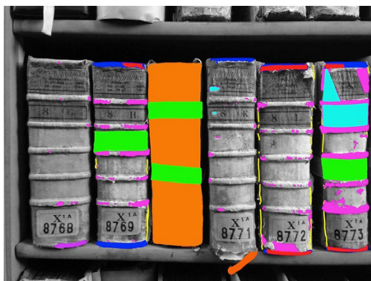
Figure 3 Carte des zones altérées sur six registres. Chaque couleur correspond à une classe d'altération. © Valérie Lee.

L'objectif de la recherche est d'obtenir une carte des zones altérées qui se superposera à la photographie du registre ( fig. 3 ). Cette carte sera ensuite transcrite en un texte qui décrira les altérations ainsi que leur niveau (état critique, moyen, bon). Ce texte pourra être facilement intégré à la base de données des Archives nationales ( fig. 4 ).