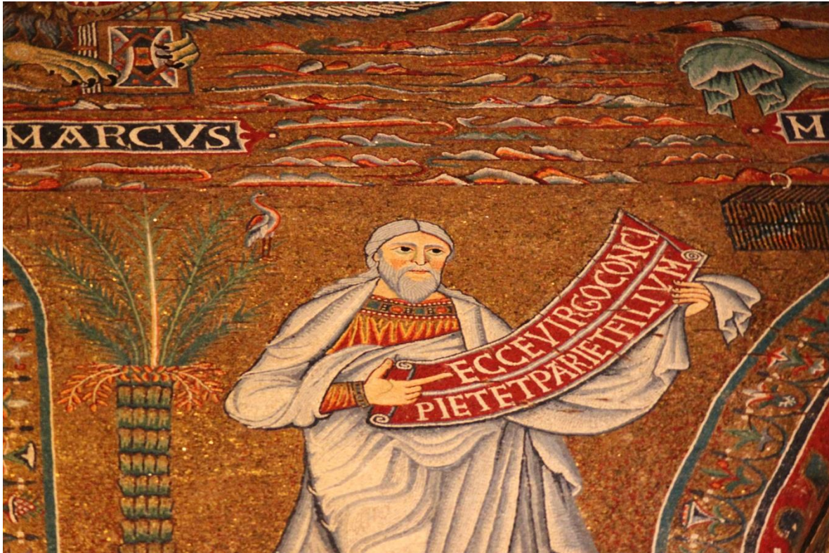
Fig. 7 : Détail de la figure d'Isaïe et du phénix, arc absidal de Sainte-Marie-du-Transtévère, Rome, v. 1143, Photographie personnelle prise le 10/07/11.

de Marie au cœur de l'abside et présente son corps glorieux sur un fond doré. L'oiseau éternel regarde en direction de l'âme prisonnière de la chair et du Christ triomphant de la mort, annonçant ainsi la résurrection des Justes et par extension, la réunion du corps et de l'âme dans l'Éden retrouvé. Les paroles monumentales dans le décor pourraient d'ailleurs entrer en écho avec le dernier chant du phénix entonné à l'aube d'une nouvelle série d'aurores dans le poème de Lactance 56 .