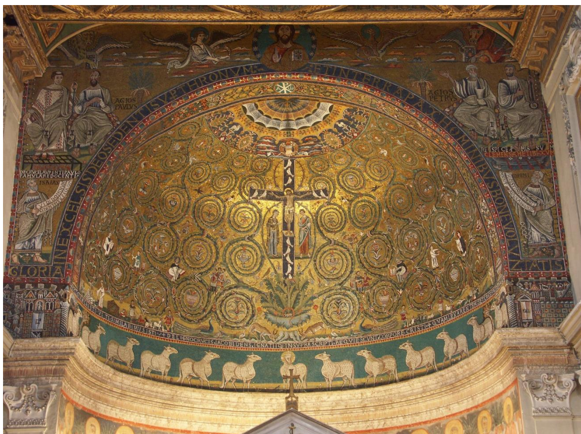
Fig. 1. : Vue actuelle de l'arc et de la conque absidale de Saint-Clément, Rome, 1118.

Les mosaïques du chœur de la basilique Saint-Clément à Rome ont été réalisées vers 1118, sous le pontificat de Pascal II (1099-1118) 1 . Répartis sur la conque et l'arc absidal de l'édifice, les éléments figurés sont distribués symétriquement autour d'un axe vertical ponctué de trois figures christiques ( fig. 1 ). Au-dessus de l'autel, le Christ est rendu présent à travers l'Agneau