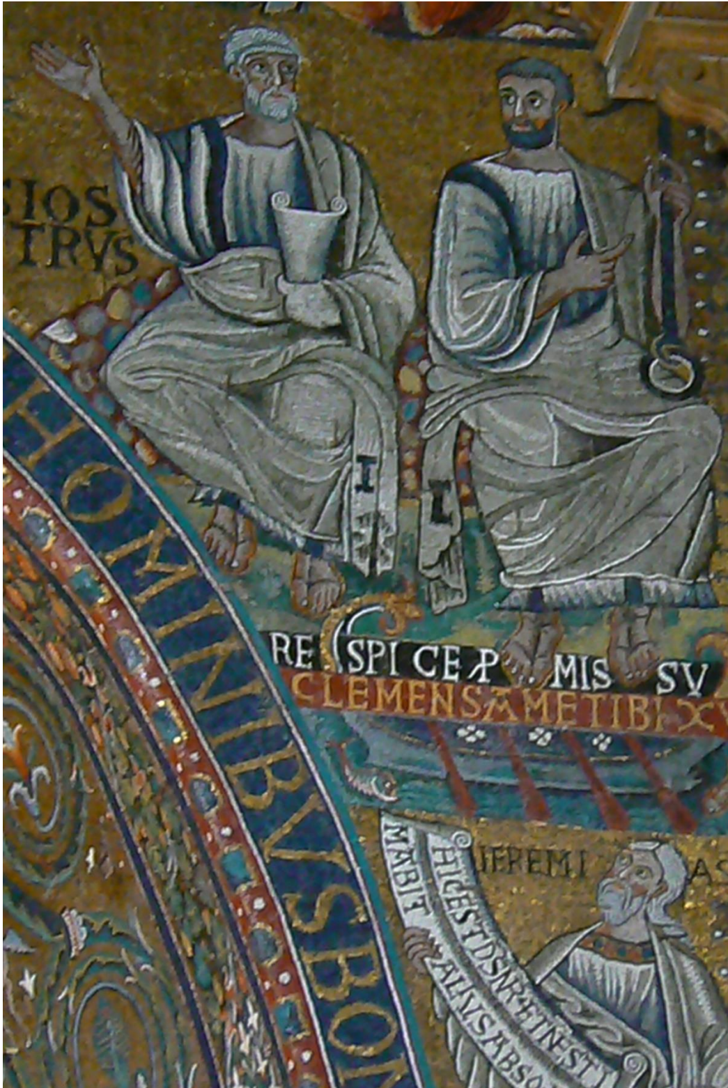
Fig. 4. : Détail des figures de Pierre, Clément et Jérémie, arc abside de Saint-Clément, Rome, 1118.

met en évidence le martyr du diacre romain Laurent († 258) 35 (fig. 3). Vêtu de sa tunique sacerdotale, Laurent porte une croix hampée dans la main gauche et désigne de l'autre main,