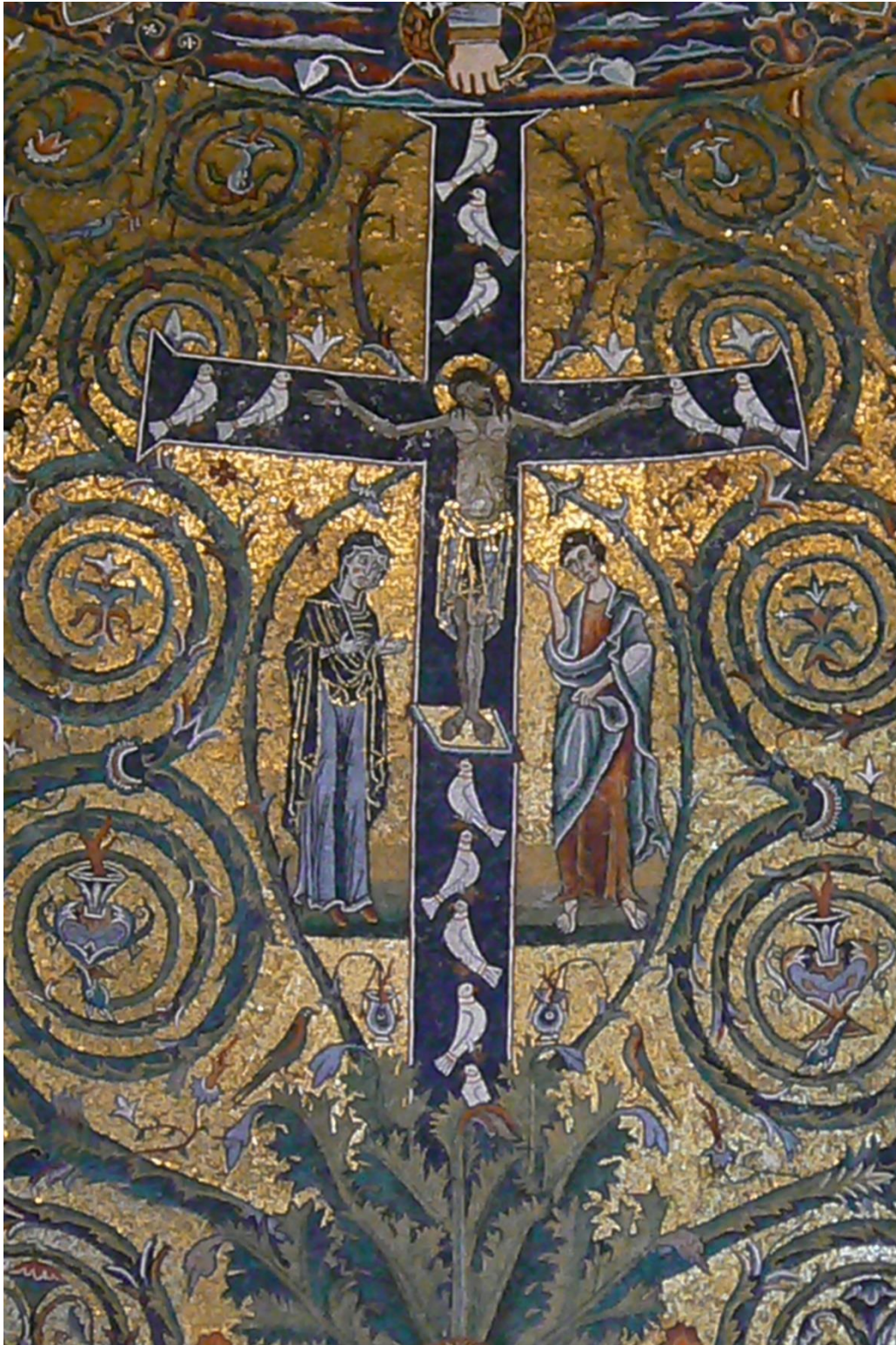
Fig. 2. : Détail de la Crucifixion, conque absidale de Saint-Clément, Rome, 1118.