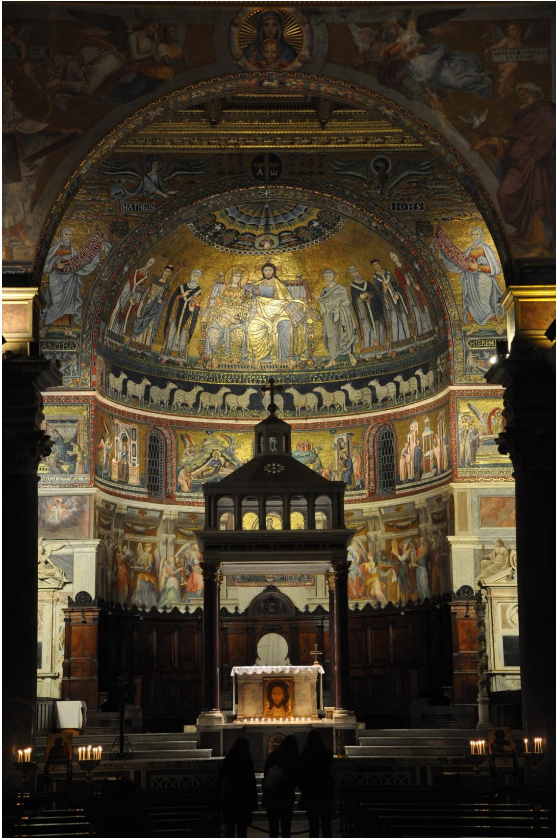
Fig. 5. : Vue actuelle de l'arc et de la conque absidale de Sainte-Marie-du-Transtévère, Rome, v. 1143