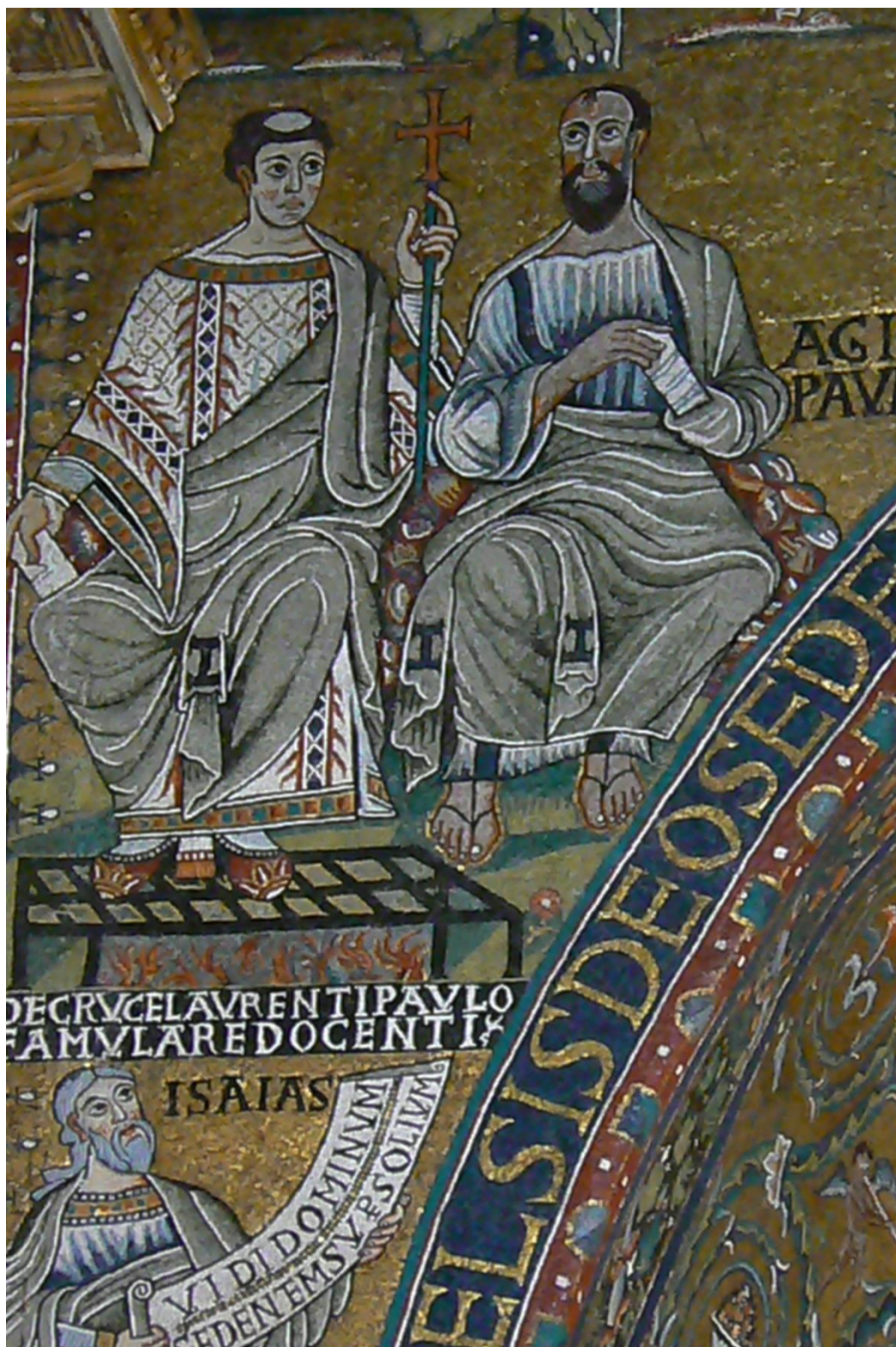
Fig. 3. Détail des figures de Paul, Laurent et Isaïe, arc absidal de Saint-Clément, Rome, 1118.

Entre les prophètes et les Évangélistes, deux couples de figures, assises près de palmier-dattiers, semblent dialoguer comme l'indiquent les inscriptions sous leurs pieds. Ces empreintes de l'oralité éclairent d'abord le sens de la scène figurée dans la partie gauche de l'arc où Paul