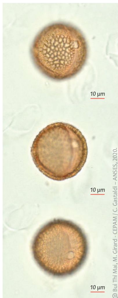
Images en vue équatoriale de Cistus ladanifer