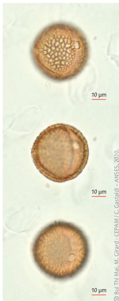
Images en vue équatoriale de Cistus ladanifer