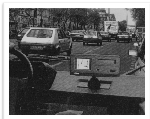
Fig. 1. Uliisse et son dispositif embarqué à l'essai (AGL 2081W28, Étude de faisabilité – dossier de prise en considération, septembre 1989, p. 4)