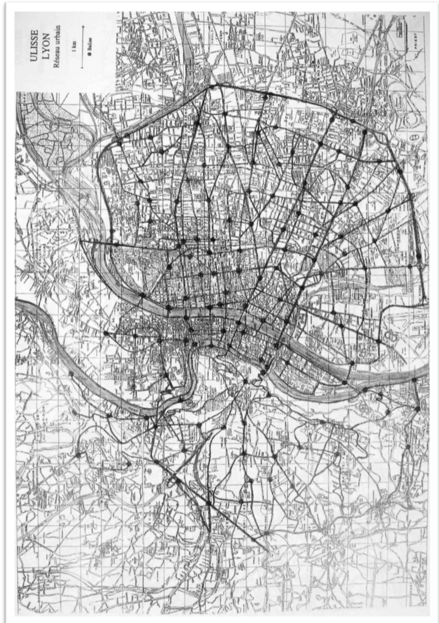
Fig. 2. Uliisse Lyon : réseau urbain projeté (AGL 2081W28, Étude de faisabilité Uliisse – définition d’une solution, novembre 1990, p. 16) (cl. droits réservés)