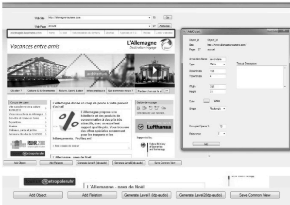
Figure 5. Interface graphique du module d'annotation du système GIVRA

Ce module propose au concepteur web d'annoter une page web en la décomposant selon les groupements visuels, en utilisant une interface graphique (figure 5). Cette interface propose les fonctionnalités nécessaires pour ajouter des objets, des groupements d'objets ainsi que leurs propriétés et les relations qui les lient.