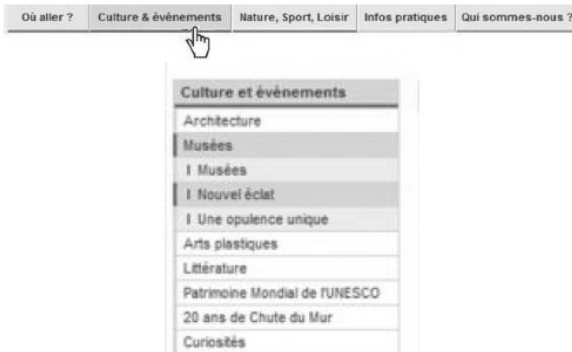
Figure 1. Menu principal et sous-menu du site de l’Allemagne

L’exemple du site d’Allemagne illustre les problèmes rencontrés dans la plupart des sites du corpus. Le menu principal est formé d’items disposés horizontalement dont la couleur du fond est la même, mais le côté inférieur du lien a une couleur différente des autres. C’est cette même couleur, mais avec un contraste plus faible, qui indique que le curseur est placé sur une case donnée. Cette même couleur est reprise dans le sous-menu qui contient trois niveaux de bleu différents et l’arborescence est réalisée par des effets de contraste de couleur, d’indentation et de soulignement vertical, effets qui ne sont également pas perçus par un lecteur d’écran.