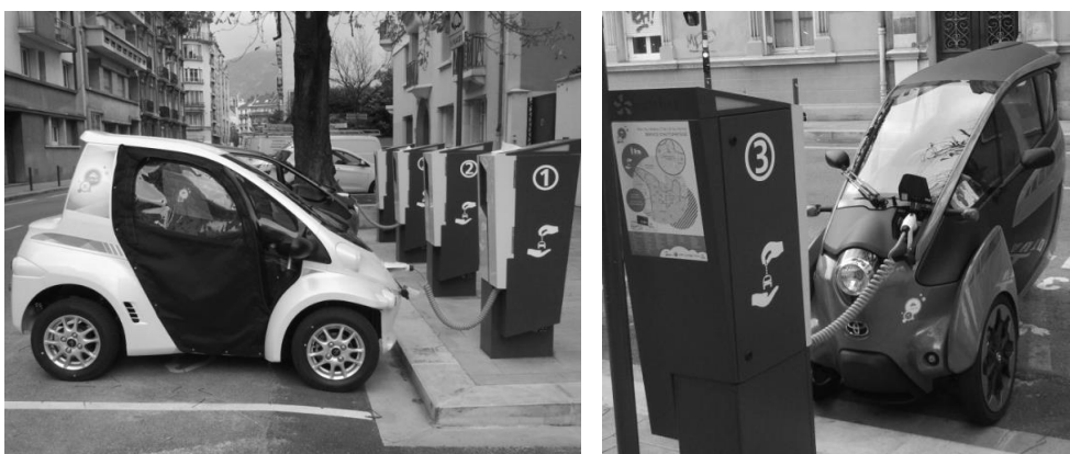
Photos 5 et 6 : Les deux types de véhicules électriques en autopartage à Grenoble

Ces petits VE ont ainsi été insérés dans une flotte d'autopartage locale pour cibler les déplacements locaux en milieu urbain, et sont gérés conjointement par des partenaires industriels, par la société d'autopartage et la Métro. Compte tenu des caractéristiques techniques de ces petits véhicules, les autopartageurs les utilisant sont appelés à cantonner leurs déplacements à Grenoble et aux quelques communes périphériques situées dans les vallées avoisinantes.