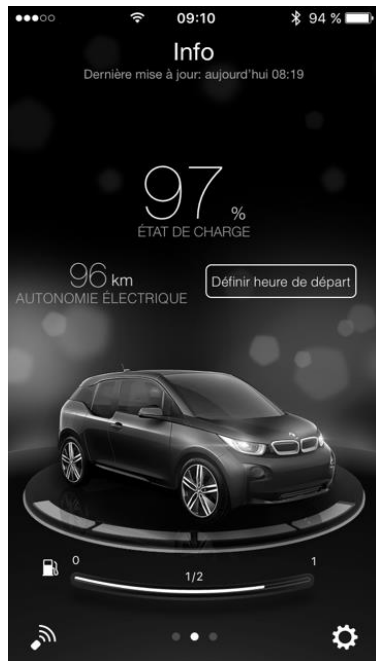
Photo 1 : Capture d'écran d'une application déportée de gestion de la charge privée : informations fournies en temps réel sur l'état de charge de la batterie et l'autonomie disponible, et sur la programmation de la charge de la BMW i3.