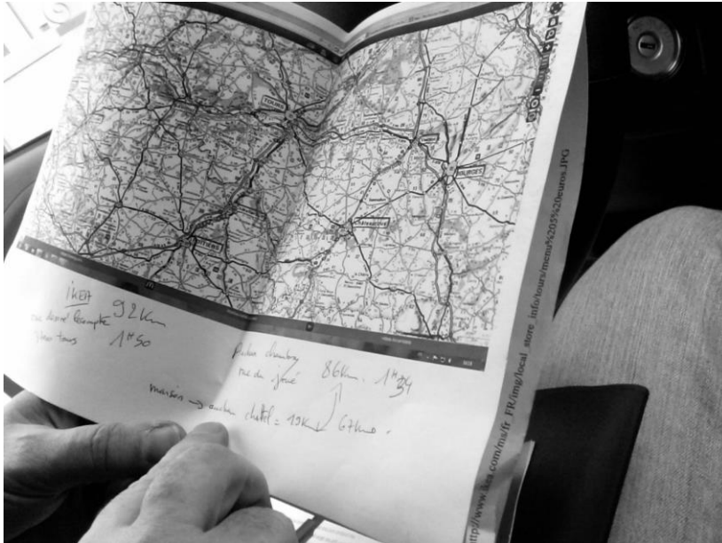
Photo 3 : Préparation des trajets : carte annotée par un utilisateur