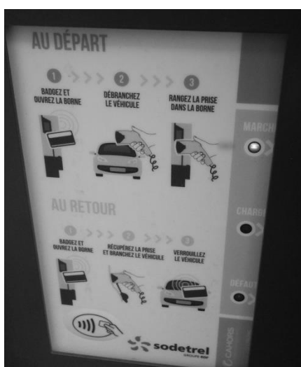
Photo 7 : Explication des procédures d'emprunt et de restitution du véhicule sur une borne

rencontrés, et ont rapidement saturé d'appels la plateforme téléphonique mise en place.