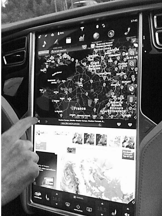
Photo 4 : Repérage d'un « lieu de recharge » sur le tableau de bord d'une Tesla

Le site Chargemap, qui existe également en application pour smartphone , permet d'adapter rapidement son trajet en cas de borne dysfonctionnelle ou occupée. Ces applications jouent alors le même rôle qu'un terminal GPS, qui permet de contrôler et d'adapter son trajet en temps réel en cas de perturbation. « J'utilise beaucoup le GPS pour évaluer si je peux encore arriver à destination » (H45, Renault Zoé). L'usage des outils d'aide à la navigation va influencer la conduite, la ralentir pour économiser de l'énergie si le conducteur perçoit qu'il pourrait se retrouver en limite d'autonomie, ou au contraire lui permettre de faire des pointes de vitesse quand il perçoit qu'il dispose d'une réserve d'autonomie confortable. Les usagers vont jouer avec les outils de la voiture et mettre en place des tactiques qui complètent les stratégies (de Certeau, 1990) mises préalablement en place lors de la planification du trajet pour réduire l'incertitude. Ainsi, le mari de F40 (Nissan Evalia) a établi un système de calcul pour leur véhicule en fonction du kilométrage et du temps ; il établit des prévisionnels qui lui permettent d'ajuster la vitesse de la voiture en se basant sur les applications de cette dernière.