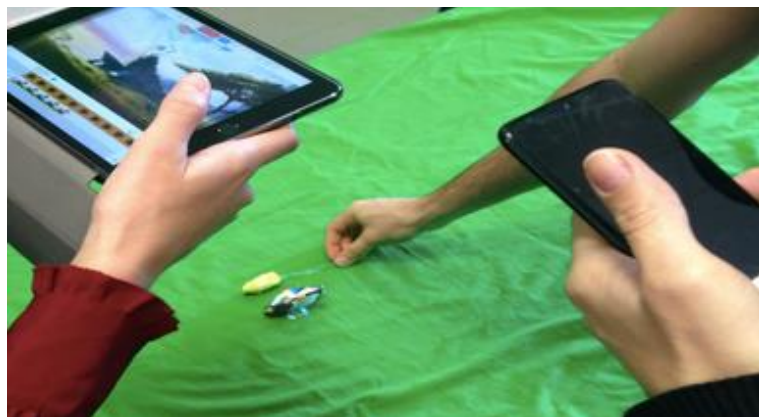
Figure 5 - Utilisation du fond vert, du smartphone pour diffuser le son, de la tablette pour filmer et d'éléments décoratifs pour sweder la scène d'un film

Le robot est souvent déguisé et les enseignants débutants doivent procéder au remake du film en utilisant la technique du swedage . La bande son est diffusée à l'aide de leur smartphone , comme le montre la scène suivante :