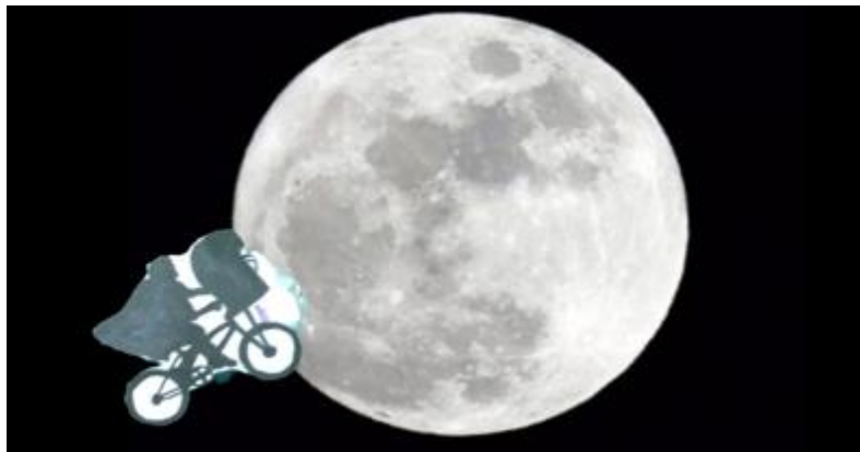
Figure 7 - Swedage d'une scène culte dans le film intitulé E.T