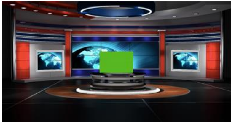
Figure 3 – Projet « Passons à l'antenne »

Nous leur demandons, par exemple, d'utiliser leur écran personnel pour rechercher des sons et les téléverser dans une plateforme de codage. Nous leur faisons également incruster des vidéos sur fond vert 6 . Les futurs professeurs de langues s'entraînent, sur ce plateau virtuel, à remplacer le journaliste en se propulsant à l'antenne d'une émission télé :