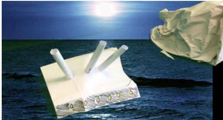
Figure 6 - Swedage de la scène où le navire vient percuter l'iceberg

Nous présentons, ci-dessous quelques-unes des productions finales 9 , toutes réalisées en temps limité :