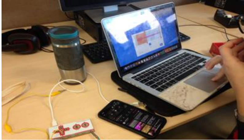
Figure 2 - Utilisation du smartphone pour intégrer des sons dans le logiciel de programmation Scratch

Nous intégrons les pratiques du smartphone en classe en proposant des défis qui vont nécessiter d'y recourir, comme l'illustre la situation suivante :