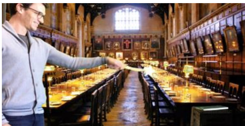
Figure 8 – Swedage de Harry Potter grâce à la technique du fond vert