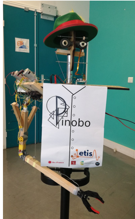
Figure 2 : Version initiale du prototype de la tête et du bras robotique.

Nous proposons une installation artistique et éducative constituée d'un bras parfois surmonté d'une tête permettant de tester la perception chez l'homme du caractère vivant d'un tel objet, qu'il soit morphologiquement proche d'un humain ou non (Fig. 2). Cette technique économique et facile à reproduire avec des outils classiques (idéalement un fablab) nous permettra de montrer au public comment produire ce type d'objets à des fins éducatives, artistiques ou ludiques.