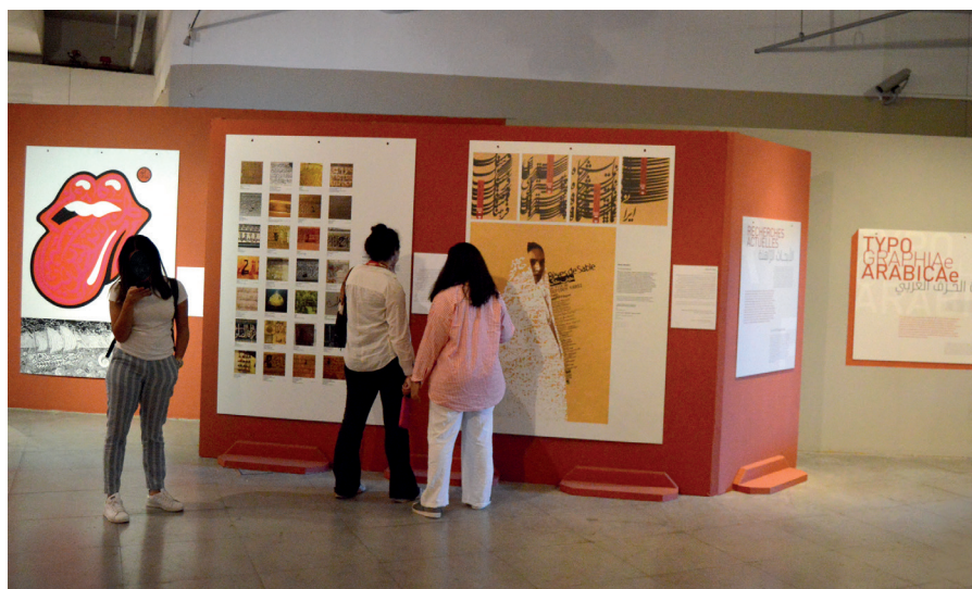
Photo 2. Exposition « TYPOGRAPHIAe ARABICAe » à la Bibliotheca Alexandrina, 2019