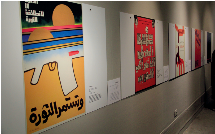
Photo 4. Exposition « TYPOGRAPHIAe ARABICAE » à la Bibliotheca Alexandrina, 2019