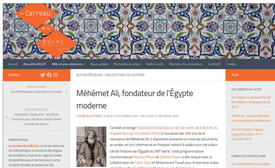
Figure 2. Exposition «Méhémet Ali, fondateur de l'Égypte moderne» sur le Carreau de la BULAC

Une autre option envisagée serait de recourir à un prestataire. Ainsi, la présentation graphique et la scénographie exceptionnelles de TYPOGRAPHIAe ARABICAe invitent à transposer virtuellement ce travail et à proposer une véritable scénographie web.