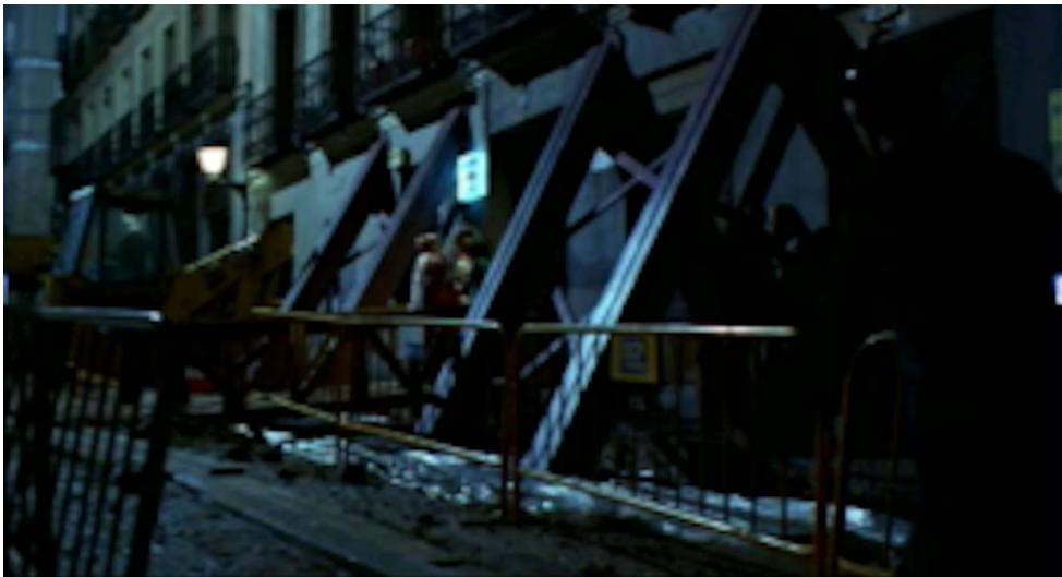
Les habitats forteresses