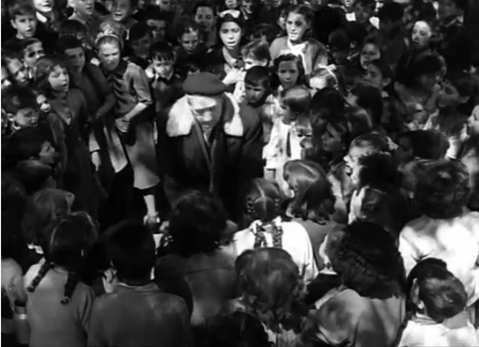
Manuel pris au piège