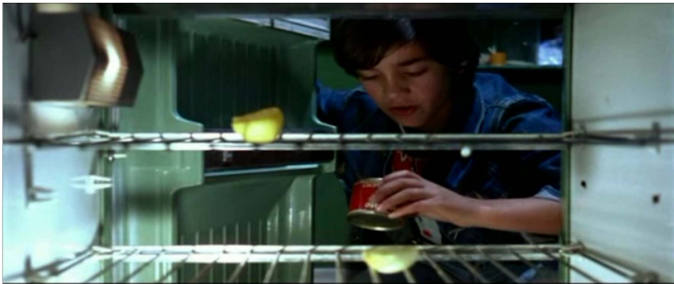
Le point de vue du réfrigérateur

Photogramme de ¿Qué he hecho yo para merecer esto!