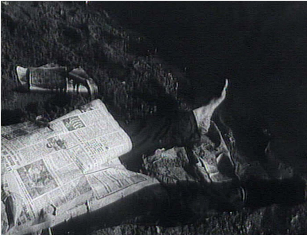
Paco mort parmi les détritius