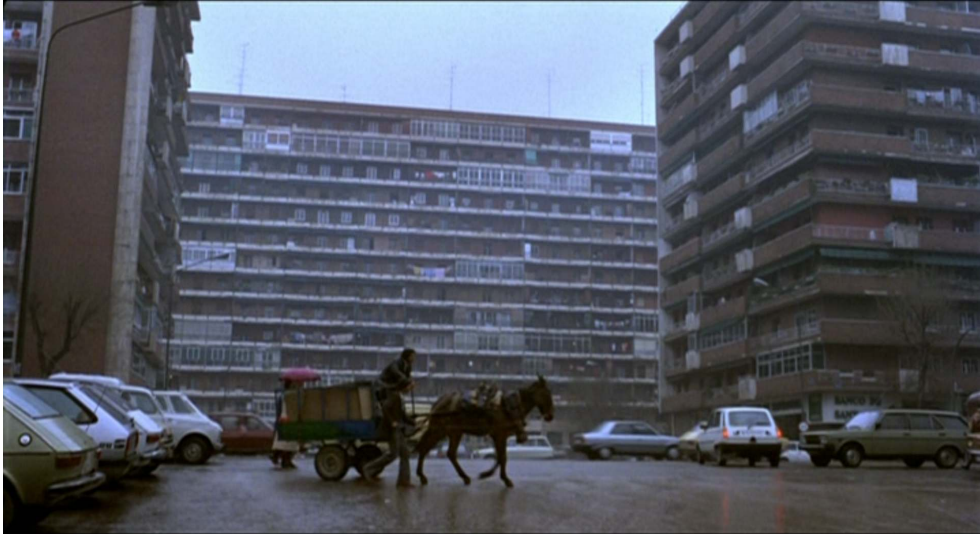
La charrette perdue au milieu des immeubles

Photogramme de ¿Qué he hecho yo para merecer esto!