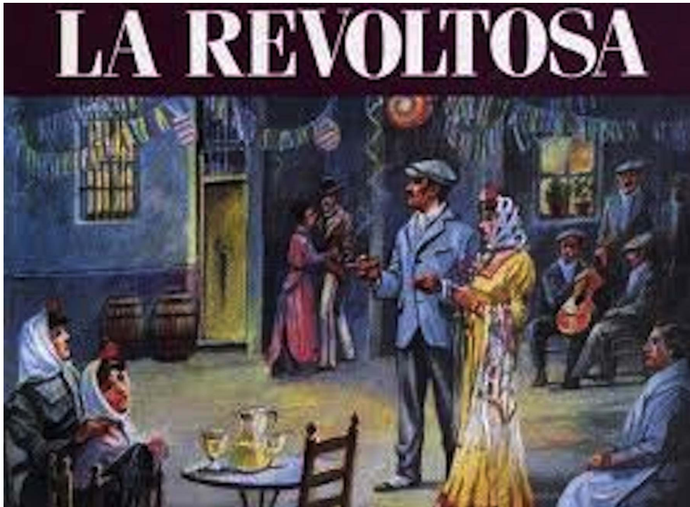
Les Madrilènes castizos