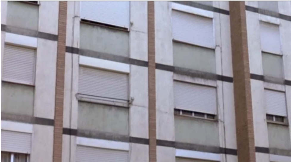
Des appartements qui emprisonnent Photogramme de Barrio