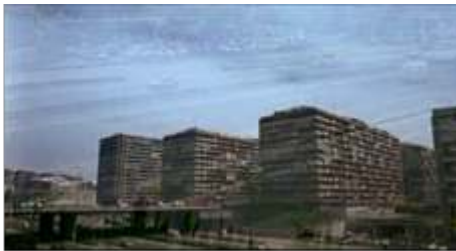
La frontière de la M-30

Photogramme de ¿Qué he hecho yo para merecer esto!