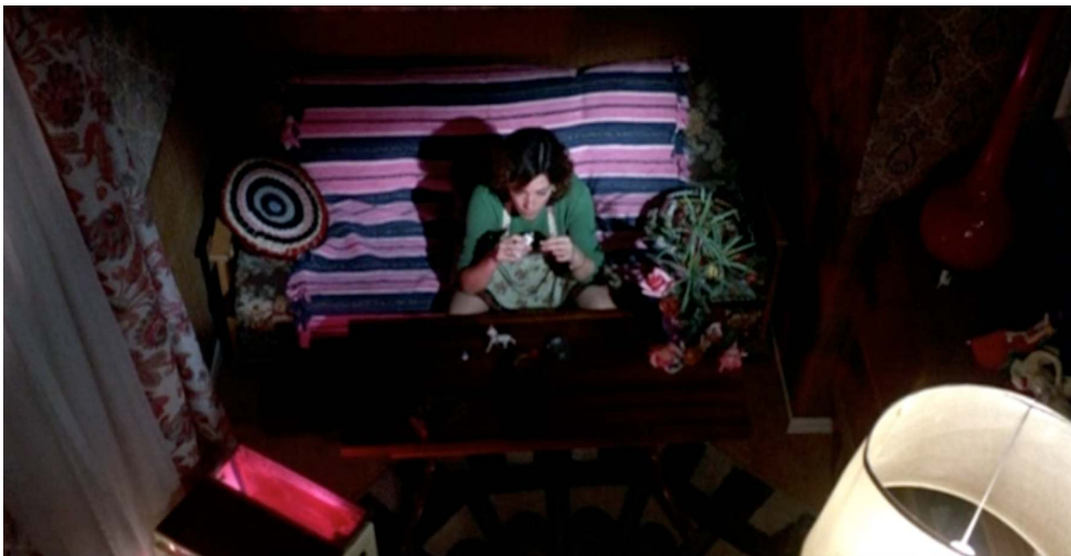
Gloria prise au piège

Photogramme de ¿Qué he hecho yo para merecer esto!