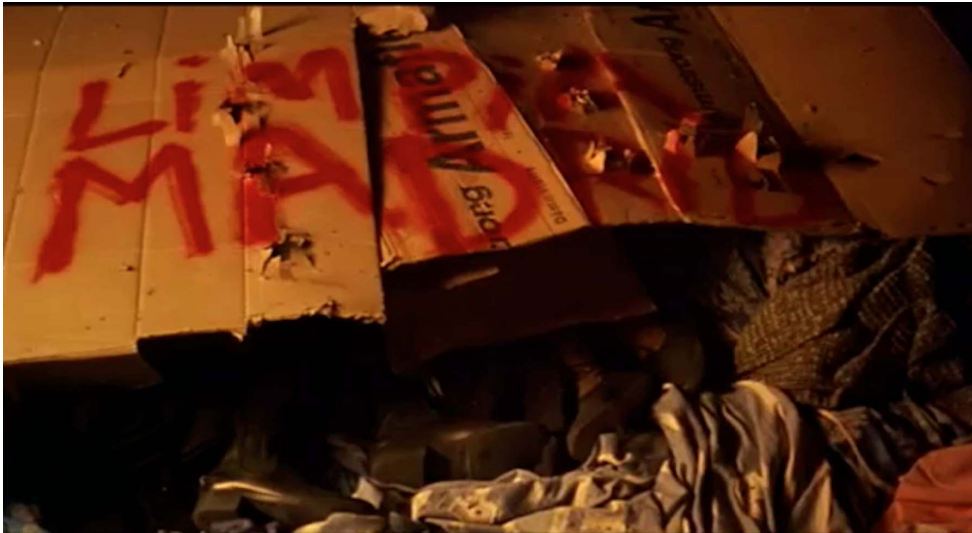
Les indigents morts sous les cartons

sauvagement assassinée. Ce plan des corps au milieu des cartons n'est pas sans évoquer la fin tragique de Paco dans Los Golfos , réduit à un débris parmi les débris.