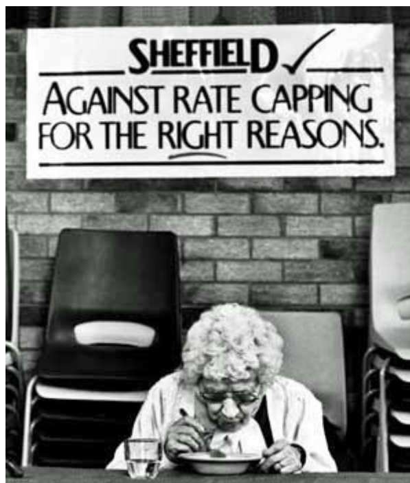
Campagne municipale contre le « rate capping », un système plafonnant le budget des autorités locales.

Dès lors, la « rentrée dans le rang » de Sheffield signifie la pleine acceptation de l'entrepreneuriat urbain, avec le rapprochement à marche forcée du gouvernement urbain avec le patronat local dès le milieu des années 1980. Mais le « retard » pris par Sheffield dans