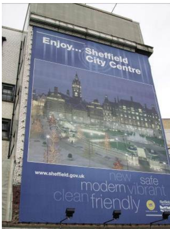
Panneau commandité par le conseil à l'entrée du centre-ville

de même, au sein de la chambre de commerce, de jeunes entrepreneurs qui n'opèrent pas dans la sidérurgie comprennent qu'un rapprochement avec la municipalité s'avère indispensable afin de ramener un « good business climate » en ville. A Sheffield, c'est justement la question de l'image de la ville qui va fournir le plus petit dénominateur commun permettant aux deux anciens « frères ennemis » de se rapprocher. Un atelier est créé en 1986 au sein de la chambre de commerce, qui se propose de plancher sur la nouvelle image de Sheffield. Rétrospectivement, celui-ci apparaît comme un moment crucial dans la trajectoire de la ville car s'y réunissent de jeunes conseillers et de jeunes entrepreneurs convaincus de la nécessité d'une approche partenariale. Une fois celle-ci formalisée, le marketing urbain prendra de plus en plus d'importance dans le redéveloppement de la ville, au gré des cibles successivement choisies par la stratégie de redéveloppement (voir Fig. 12).