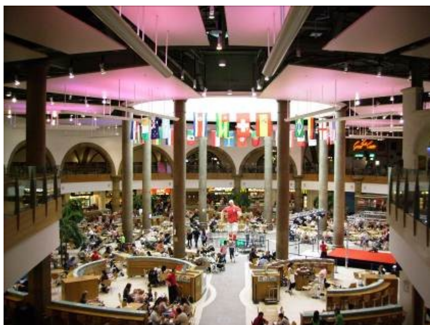
Centre commercial de Meadowhall, Sheffield (Max Rousseau, 2006)

cette conversion, l'étroitesse de la marge de manœuvre du nouveau régime urbain ainsi que la gravité des problèmes économiques et sociaux dans la ville débouchent sur la prise de deux décisions fortement controversées, toutes deux dès 1986. La première est celle d'accueillir les World Student Games, un méga-projet destiné à transformer l'image de la ville, qui impliquait la construction dans la ville de plusieurs stades aux normes olympiques mais qui dégradera fortement des finances locales déjà en difficulté. La seconde est celle d'autoriser la construction de l'un des principaux centres commerciaux d'Europe dans la périphérie de la ville. La concurrence exercée par celui-ci détruira l'armature commerciale du centre-ville dès le début des années 1990 (voir Fig. 2 et 3).