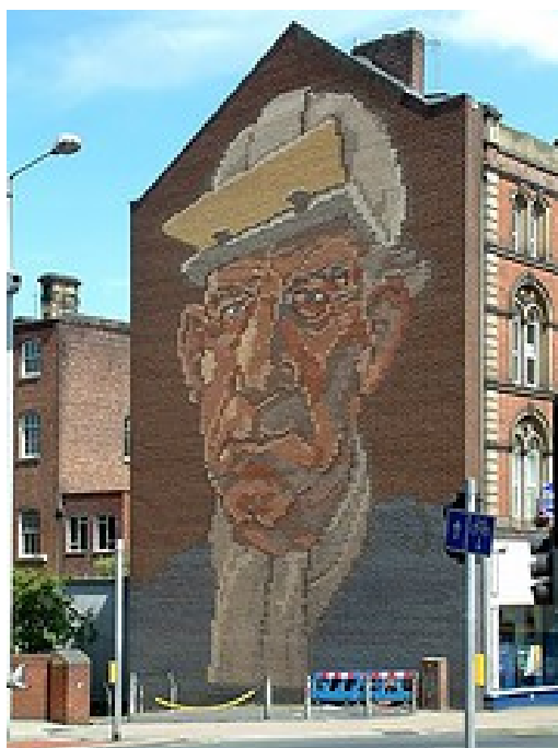
Fresque du centre-ville, commanditée par le conseil de la New Urban Left en 1984 et représentant le visage d'un sidérurgiste (Max Rousseau, 2006)

de ses principaux projets à Sheffield, le quartier des industries culturelles lancé au début des années 1980, ait été pleinement récupéré par l'entrepreneurialisme urbain qui exalte la « classe créative ». Au plan symbolique, il reste également une immense fresque en centre-ville, commanditée par le conseil en 1986 et qui représente le visage d'un sidérurgiste (voir Fig. 13).