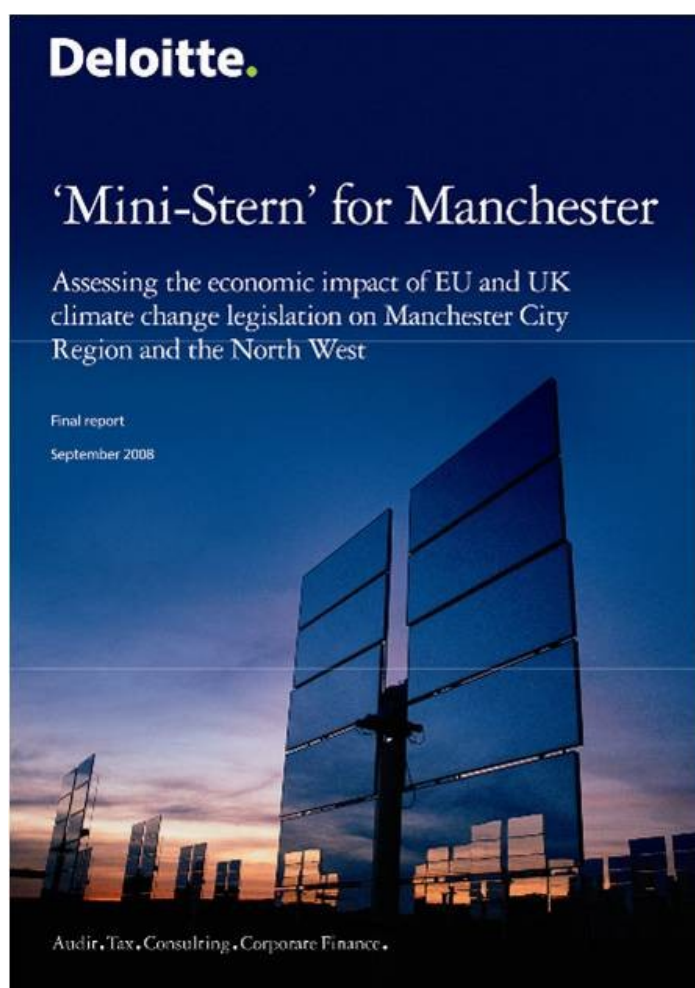
Étude sur l'impact du changement climatique sur l'économie du Greater Manchester (Deloitte, 2008)

Cette étude souligne certes les conséquences négatives que pourrait avoir le changement