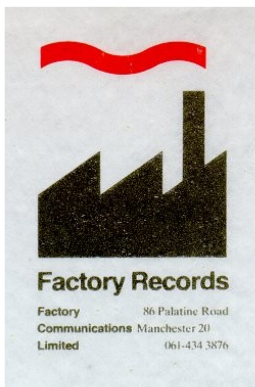
Label mancunien fondé en 1978 par Tony Wilson et Alan Erasmus (Factory records, 1978)

concentraient dans quelques quartiers comme le Northern Quarter ou Hulme, un quartier de grands ensembles qualifié à l'époque de « plus grand squat d'Europe ». Ces mouvements avaient leurs pendants musicaux avec des groupes d'abord de new wave comme Joy Division et New Order, puis d'acid house comme Happy Mondays. Ainsi, tout une dynamique s'est structurée, notamment autour du label mythique de Tony Wilson, Factory Record, et de la discothèque non moins mythique, l'Hacienda. C'est cette dynamique qui va positionner Manchester comme une ville alternative, contre-culturelle et révolutionnaire (voir Fig. 5).