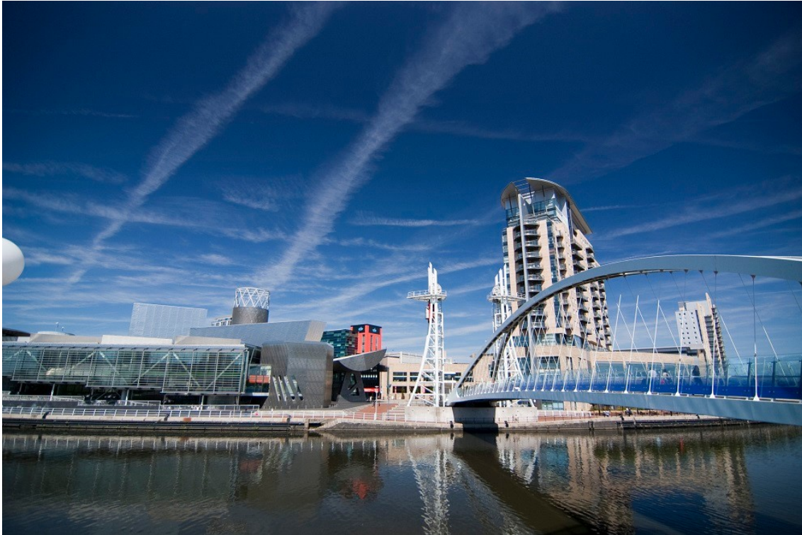
Salford Quays (City of Salford, 2014)

Au milieu des années 1990 une autre phase, cette fois-ci de roll-out, s'ouvre. Elle voit l'émergence de nouvelles politiques urbaines permettant à la fois de répondre à certaines des contradictions de la période précédente (problèmes sociaux, dommages environnementaux, etc.), tout en poursuivant l'objectif d'instaurer une société de marché. L'intérêt de cette périodisation est double. D'une part, elle offre des pistes pour comprendre l'apparition de nouvelles catégories dans les politiques urbaines comme la mixité, l'empowerment, la communauté ou encore la durabilité qui ont été pensées par Tony Blair et les siens comme des outils permettant de faire la synthèse entre les logiques de marché, la responsabilisation individuelle et les discours volontaristes sur la réduction des tensions sociales ou environnementales ; synthèse qui a été bien étudiée dans l'ouvrage des politistes Patrick Le Galès et Florence Faucher-King, Les gouvernements New Labour : le bilan de Tony Blair et Gordon Brown , paru en 2010. D'autre part, elle permet également de comprendre le glissement des stratégies de compétitivité urbaine qui étaient dominées jusqu'à la fin des années 1990 par un souci de positionner les villes dans la division internationale de la production, notamment pour l'attraction de firmes, et qui se recomposent aujourd'hui en se recentrant sur le positionnement au sein de la division internationale de la consommation, pour attirer des groupes sociaux jugés désirables.