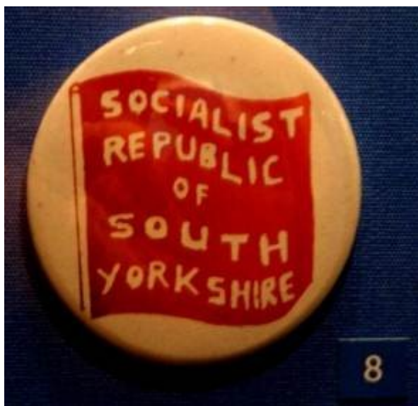
Badges « Socialist Republic of South Yorkshire » (archives municipales)

Donc, les véritables débuts du marketing urbain résultent bien du tournant entrepreneurial, et de la transition depuis le gouvernement urbain vers la gouvernance urbaine, pour reprendre le titre d'un article de Patrick Le Galès. On peut même dire que dans le cas de Sheffield, le travail conscient sur l'image apparaît rétrospectivement comme le moteur du tournant entrepreneurial – et non pas comme son résultat. Pour comprendre ce paradoxe, il faut revenir au milieu des années 1980. La ville est alors en plein marasme économique, le taux de chômage s'envole et il devient de plus en plus clair que la stratégie de développement alternative promue par le conseil s'avère une impasse. Par ailleurs, depuis quelques années, un climat de franche hostilité s'est développé entre la municipalité et la chambre de commerce. Pourtant, les deux frères ennemis se retrouvent désormais contraints de collaborer : l'autorité locale désormais dépourvue d'une stratégie alternative se retrouve obligée de jouer le jeu du rapprochement avec le secteur privé ;