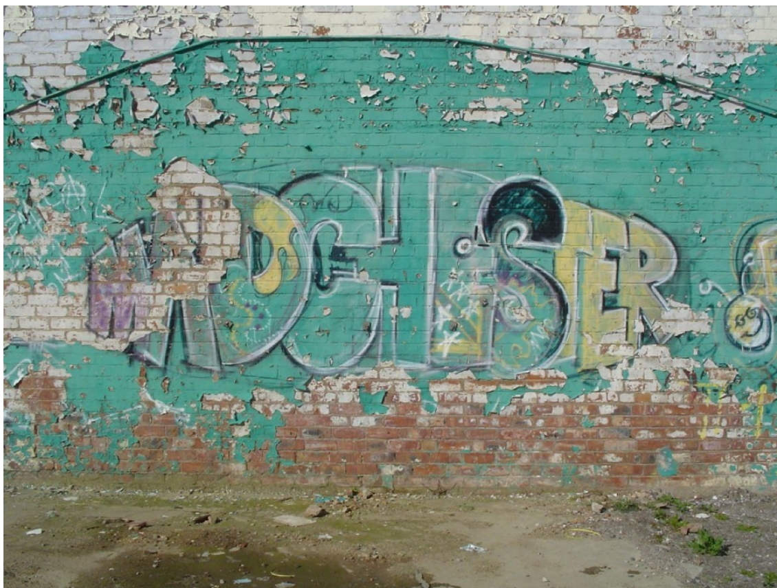
Graffiti « Madchester » inspiré du surnom donné à Manchester