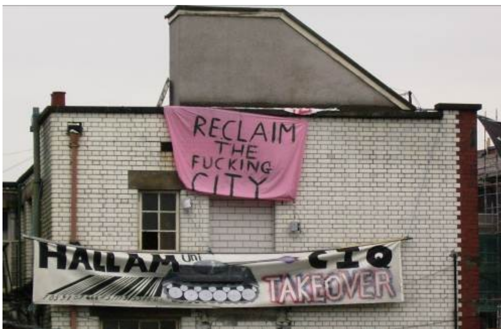
Contestation au moment de l'expulsion d'un squat dans le quartier de l'université Hallam à Sheffield, accusée de poursuivre une stratégie immobilière (Max Rousseau, 2005)

De fait, l'approche du redéveloppement par l'appui au secteur immobilier poursuivie à Sheffield depuis la fin des années 1980 trouve ses limites, notamment depuis la crise de 2008. Plusieurs promoteurs qui s'étaient vu attribuer la mission de réaliser des projets prioritaires ont fait défection ou ont montré des signes de faiblesse. Par exemple, la construction de la St. Paul's Tower, la plus haute de la ville et qui était censée constituer un signe du renouveau, a pris un retard important suite à la faillite du promoteur, et ses ambitions ont été revues à la baisse, ce qui est difficile à digérer pour la municipalité. De même, le redéveloppement de Park Hill, un grand ensemble surplombant le centre-ville construit par le conseil dans les années 1960, est devenu un véritable feuilleton. Emblématique du brutalisme (un courant de l'architecture moderne), Park Hill est un quartier célèbre dans toute l'Angleterre où il est soit révééré, soit, le plus souvent, détesté. Le conseil avait choisi de le rénover et avait choisi pour ce faire l'également célèbre promoteur mancunien Urban Splash, spécialisé dans la conversion de bâtiments industriels en lofts. C'était un signe clair du nouvel usage du quartier iconique de Sheffield, depuis les logements publics construits pour les ouvriers vers des logements privés à destination des étudiants et des « créatifs » (voir Fig. 8).