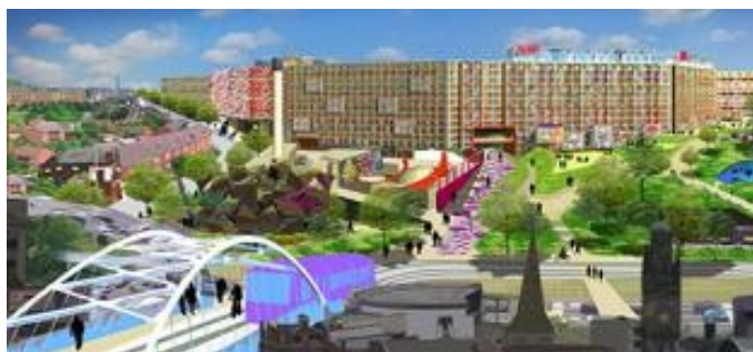
Projet de rénovation de Park Hill par le promoteur Urban Splash (Urban Splash, 2007)

De fait, l'approche du redéveloppement par l'appui au secteur immobilier poursuivie à Sheffield depuis la fin des années 1980 trouve ses limites, notamment depuis la crise de 2008. Plusieurs promoteurs qui s'étaient vu attribuer la mission de réaliser des projets prioritaires ont fait défection ou ont montré des signes de faiblesse. Par exemple, la construction de la St. Paul's Tower, la plus haute de la ville et qui était censée constituer un signe du renouveau, a pris un retard important suite à la faillite du promoteur, et ses ambitions ont été revues à la baisse, ce qui est difficile à digérer pour la municipalité. De même, le redéveloppement de Park Hill, un grand ensemble surplombant le centre-ville construit par le conseil dans les années 1960, est devenu un véritable feuilleton. Emblématique du brutalisme (un courant de l'architecture moderne), Park Hill est un quartier célèbre dans toute l'Angleterre où il est soit révééré, soit, le plus souvent, détesté. Le conseil avait choisi de le rénover et avait choisi pour ce faire l'également célèbre promoteur mancunien Urban Splash, spécialisé dans la conversion de bâtiments industriels en lofts. C'était un signe clair du nouvel usage du quartier iconique de Sheffield, depuis les logements publics construits pour les ouvriers vers des logements privés à destination des étudiants et des « créatifs » (voir Fig. 8).