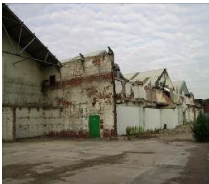
Friches industrielles à proximité de Meadowhall (Max Rousseau, 2006)