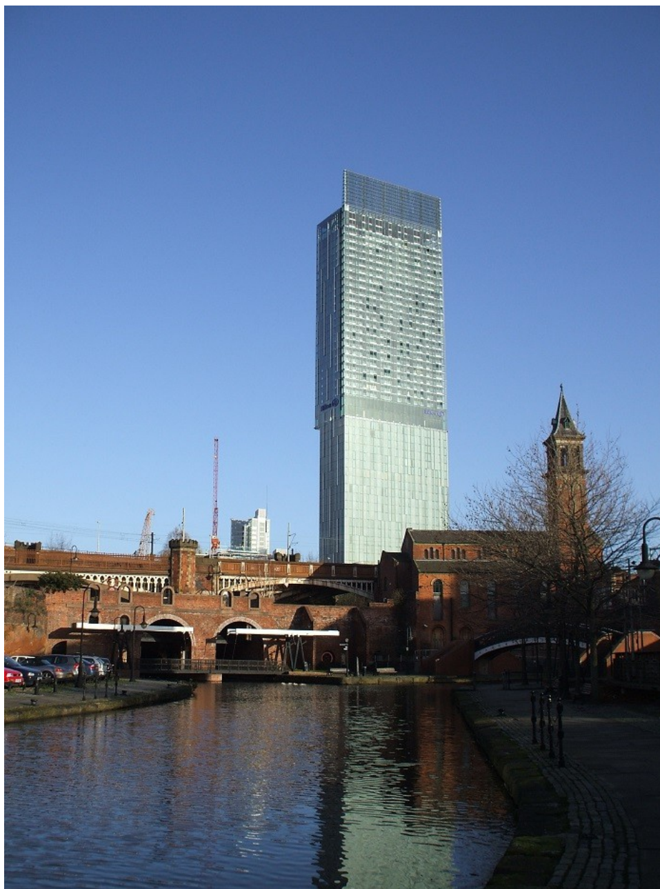
La Beetham Tower (Vincent Béal, 2006)

Toutefois, si la ville a réussi à transformer son économie et à améliorer son image, elle est aussi devenue une ville beaucoup plus duale où se côtoient des espaces très dynamiques qui connaissent un développement immobilier impressionnant comme le centre-ville, sa proche périphérie avec des quartiers comme Hulme et Ancoats, ou encore les quais de Salford, et des espaces de relégation extrême comme les quartiers Est. Malgré le lancement d'ambitieux politiques de régénération à la fin des années 1990 pour préparer l'organisation des Jeux du Commonwealth, ces quartiers restent parmi les plus défavorisés d'Angleterre et, à l'exception de quelques enclaves comme l'éco-quartier de New Islington, leur situation n'a quasiment pas évolué depuis 20 ans. Depuis la crise de 2007, les inégalités se sont encore renforcées dans la ville, comme un peu partout ailleurs au Royaume-Uni. Toutefois, Manchester a été l'une des villes qui a le mieux résisté en parvenant à entretenir la dynamique entrepreneuriale engagée