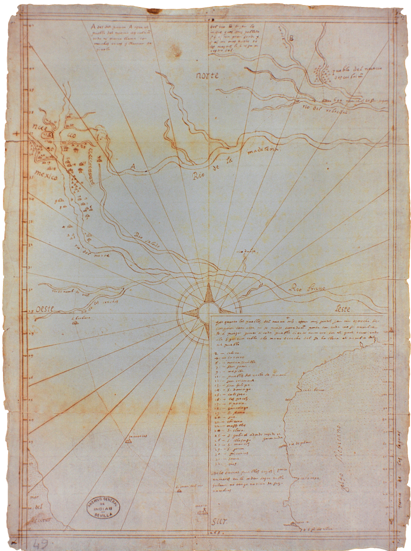
Figura 2. [Enrico Martínez] Rasguño de las provincias de la Nueva Mexico (...) [1602] (AGI, MP-Mexico, 49).