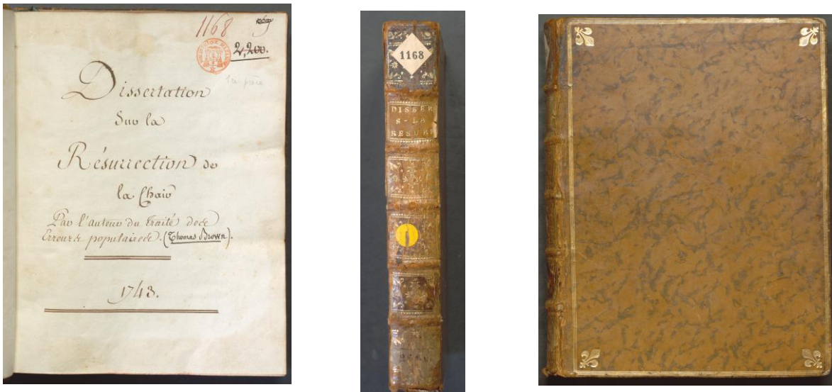
Figure 2: Bibliothèque Mazarine, manuscrit 1168.

L'inventaire mentionne pourtant quelques titres de manuscrits conservés dans des versions uniques ou rares, et qu'il est facile de vérifier. C'est le cas, par exemple, de la « Dissertation sur la resurrection de la cher, par l'auteur du Traité des erreurs populaires 1743, manuscrit in-4° », dont le seul exemplaire connu est conservé à la Bibliothèque Mazarine, sous la cote 1168. La page de titre reprend exactement la description de l'inventaire, à ce détail près, le nom de Thomas Brown, ajouté à posteriori , qui attribue de manière erronée le texte à un auteur anglais du XVII e siècle, auteur certes d'un Traité des erreurs populaires , mais qui n'a rien à voir avec ce manuscrit 43 . Il s'agit bien d'ailleurs d'un volume in-4°, relié en veau fauve, les plats ornés d'un triple filet d'or, avec une fleur de lys à chaque angle. Le dos présente cinq nervures, il est décoré de fleurons datables du XVIII e siècle, la pièce de titre est en maroquin rouge, avec des lettres dorées. Ce volume se présente en réalité comme un recueil, et comporte une deuxième pièce la Dissertation sur la formation du monde , attribuée au même auteur et apparemment de la même main.