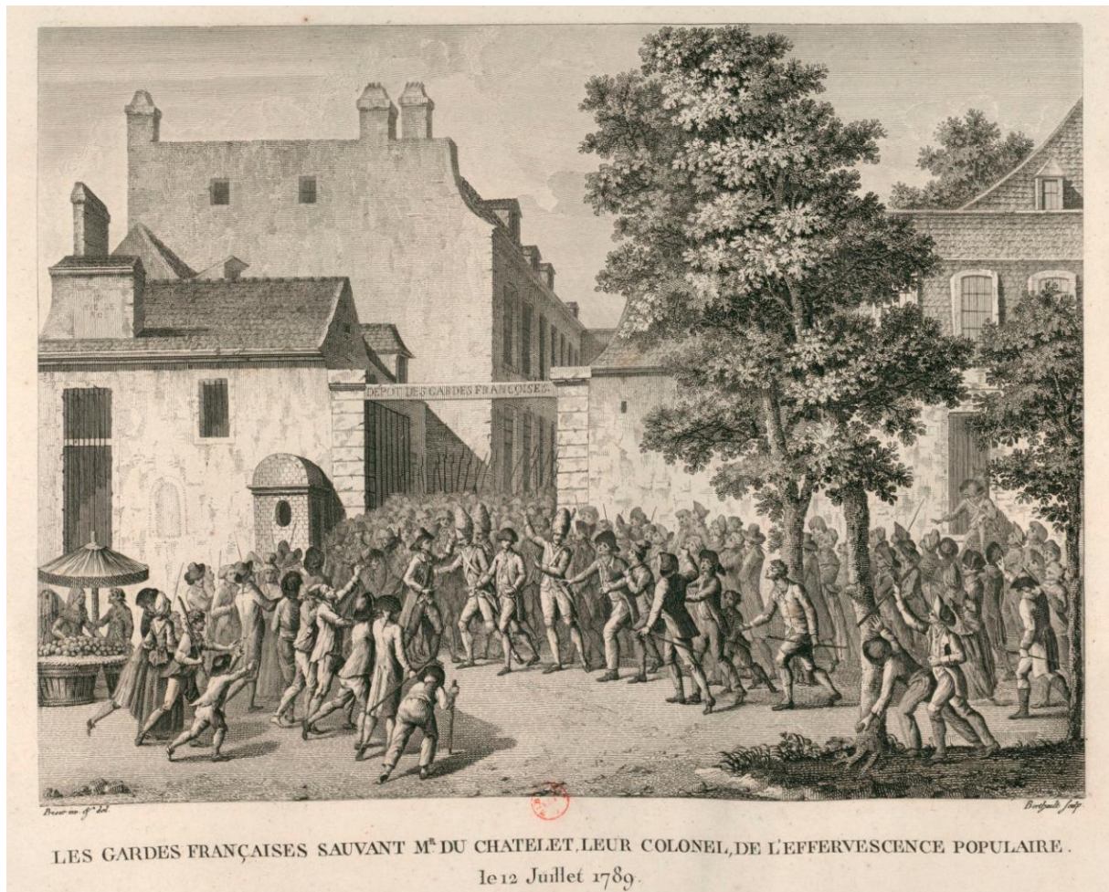
Figure 1 : Les Gardes françaises sauvant Mr. Du Châtelet, leur colonel, de l'effervescence populaire. Le 12 juillet 1789. Prieur inv. & del.; Bertheult sculp. Eau-forte 18x23,5 cm. B.n.F. FRBNF44542710

Le point de départ de cette enquête est donné par l'analyse de l'inventaire de saisie de la bibliothèque de Louis-Marie-Florent d'Haraucourt, dernier Duc Du Châtelet, autrement dit, le fils d'Émilie du Châtelet. À peine plus jeune que le baron d'Holbach, puisqu'il est né en 1727, Louis-Maire-Florent était, au moment de la Révolution, colonel des Gardes de la Maison du Roi et de ce fait, s'est directement trouvé impliqué dans les événements de juillet 1789, comme nous le rappelle une gravure représentant les événements du 12 juillet.