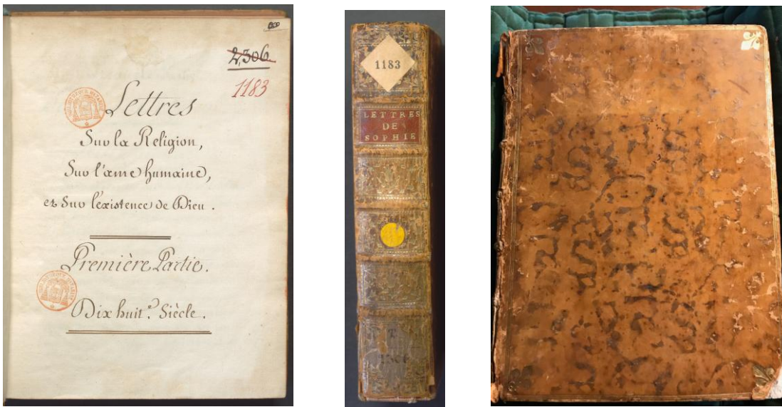
Figure 3 : Bibliothèque Mazarine, manuscrit 1183

Comme j'ai pu le montrer ailleurs, les caractéristiques physiques de ces volumes, permettent de confirmer qu'une bonne partie des copies décrites dans l'Inventaire de saisie de la bibliothèque du duc Du Châtelet sont aujourd'hui conservées à la Bibliothèque Mazarine 44 . Les mêmes caractéristiques matérielles peuvent être observées dans certains des ouvrages dont l'appartenance au duc Du Châtelet ne saurait être contestée, conservés dans le fonds ancien de l'École Nationale des Ponts-et-Chaussées, comme la Recherches sur la nature du feu de l'enfer, et du lieu où il est situé , volume in-8°, un livre plutôt rare, publié à Amsterdam en 1728, dans lequel son auteur, l'anglais Tobias Swinden, essaie d'expliquer que l'enfer se trouve au cœur du soleil.