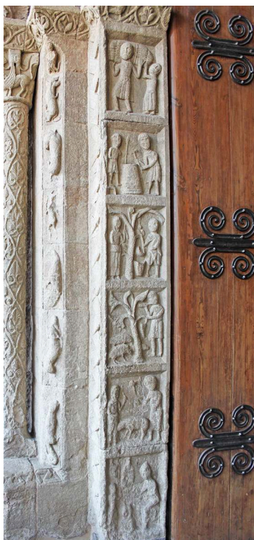
Fig. 4 – Ripoll, Santa Maria, portail occidental, face intérieure du piédroit, les occupations des mois (juillet à décembre).