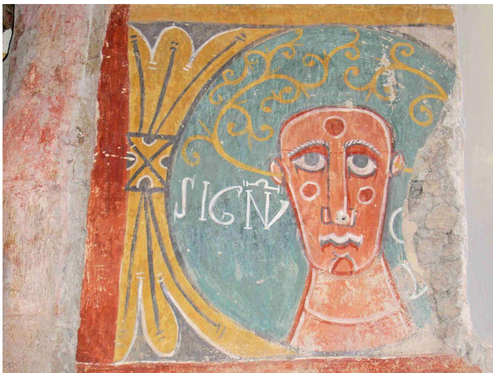
Fig. 3 – Ourjout, Saint-Germier, registre inférieur de l'abside, détail, le signe du vent de Mars (?).