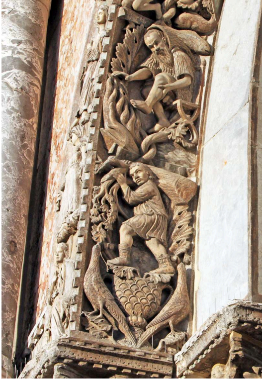
Fig. 2 – Venise, San Marco, portail central, archivolt, détail, janvier/le Verseau et février (cl. A. Ferrand, octobre 2013).

mois de janvier se confondent avec l'onde se déversant du vase du Verseau, de sorte que le bois devient eau dans une image dont on ne soupçonne pas au premier abord la profondeur sémantique 8 .