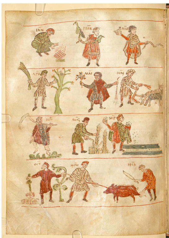
Fig. 7 – MÜNCHEN, Bayerische Staatsbibliothek , Clm 210, fol. 90v o .

[ http://creativecommons.org/licenses/by-nc-sa/4.0/deed.de https://portail.bibliissima.fr/ark:/43093/mdata20685b478dd116b98a3253547cad37ddbaf09ca ].