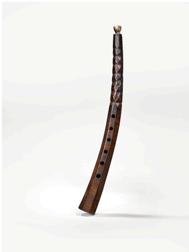
Figure 4 : Cornet à bouquin soprano, Italie, XVII e siècle (?), coll. musée de la Musique, Paris, E.979.2.25, cliché Claude Germain.

Jean-Philippe Échard, La musique dans la Tenture des Fêtes des Valois , in « la Tenture des Fêtes des Valois – Tisser les fêtes de Catherine de Médicis », Oriane Beaufiles (dir.), Château de Fontainebleau/Liénart, 2022, p. 63-67.