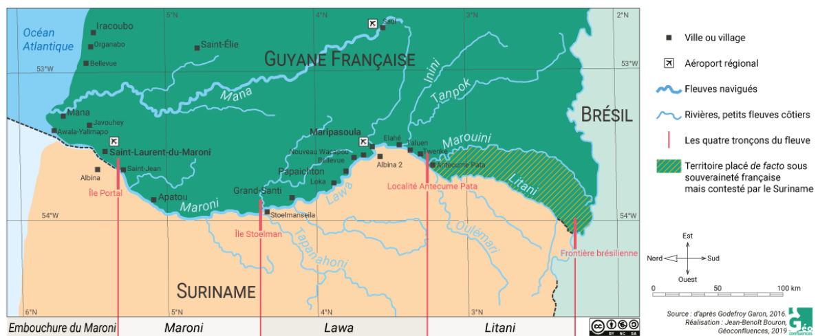
Carte 1: La frontière entre la Guyane française et le Suriname

La situation sur le Maroni (carte 1), où le fleuve dessine une frontière encore moins marquée avec la France que celle de l'Oyapock avec le Brésil, est plus sensible que celle sur l'Oyapock, également victime de l'orpillage illégal. D'où notre attention portée sur le fleuve Maroni. D'après le responsable du bureau Guyane du WWF France, « entre 2006 et 2018, énormément d'installations se sont mises en place au Suriname avec l'objectif de fournir un soutien logistique à l'orpillage illégal. La dimension transfrontalière est donc essentielle, surtout autour du fleuve Maroni» 5 . Selon le dernier rapport du Parc amazonien de Guyane, « 85 % de la logistique liée à l'exploitation illégale de l'or provient du Suriname » et plus précisément « 85 % des saisies de matériel logistique avaient été acheminées depuis le Suriname » 6 .