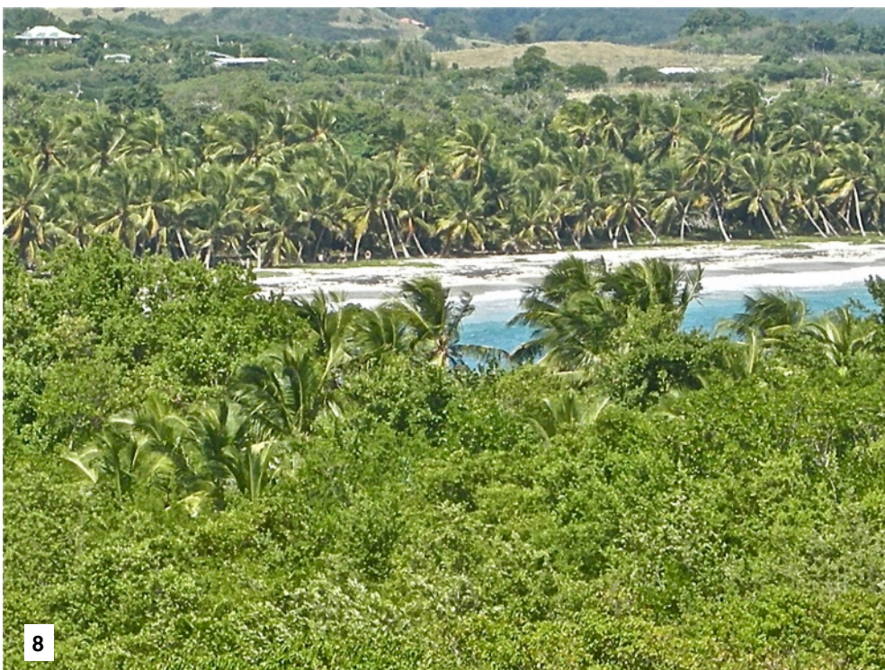
Fig. 7 - 8. - Variations paysagées des zones xérophiles de Grand Macabou, Le Vauclin, Martinique.