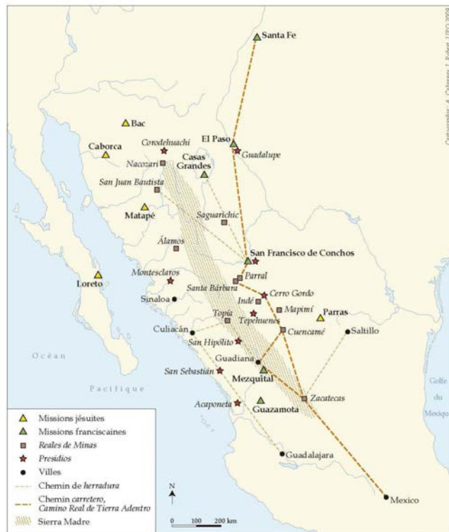
Figure 1 – Le Nord-ouest de la Nouvelle-Espagne à la fin du XVII e siècle