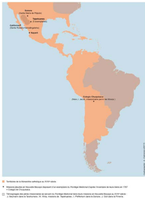
Figure 3 – Diffusion du Florilège Médicinal au XVIII e siècle, d'après Esteyneffer (1978), p. 25-29