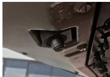
(b) un type de CAM