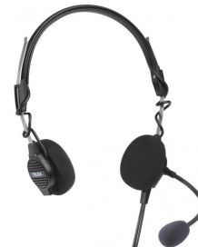
(c) un type d'équipement de tête