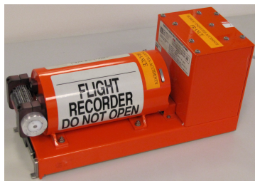
(a) un type de CVR

Avant d'être enregistrés sur la carte mémoire de l'enregistreur, les signaux provenant des voies pilotes et du CAM sont sous-échantillonnés respectivement à 7 kHz et 12 kHz, puis compressés au standard ADPCM (Adaptive Differential Pulse Code Modulation).