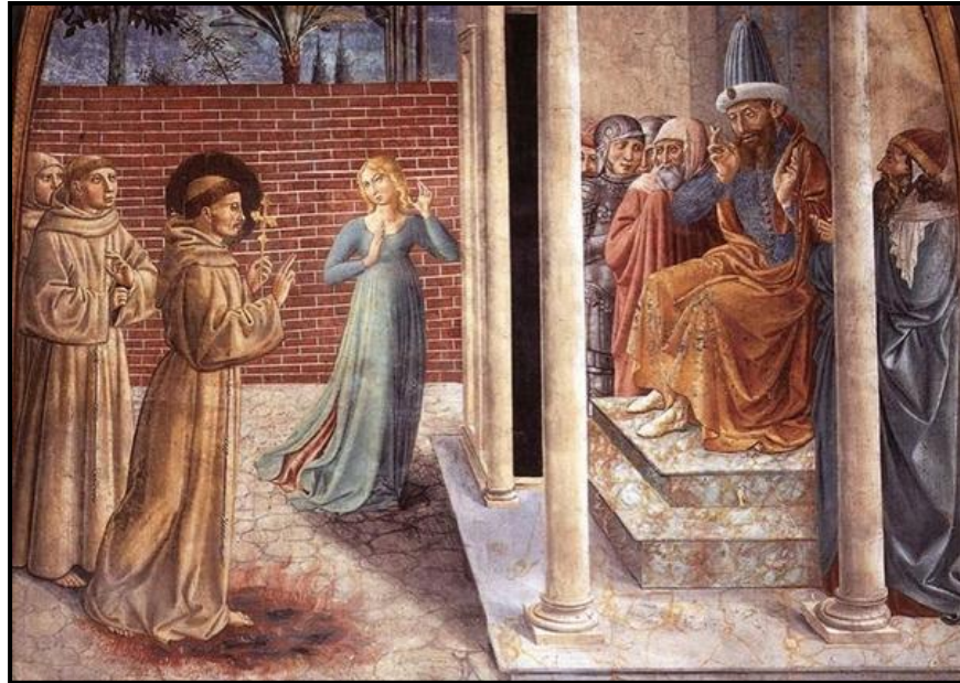
Benozzo Gozzoli Église de San Francesco (Montefalco)

À la même époque, les éléments constitutifs de la visite représentée par Benozzo Gozzoli sur les fresques de l'église de San Francesco à Montefalco (Ombrie) évoluent. Cette fois, la scène se déroule dans une cour où l'on voit François. Tenant un crucifix doré dans la main, il avance, pieds nus, vers le sultan. Ce dernier lève les deux mains et paraît étonné. L'artiste ôte toute ambiguïté sur l'épreuve des flammes : il s'agit bien d'un miracle puisque François marche sur la braise. Mais Gozzoli propose aussi une autre innovation avec la présence d'une figure féminine blonde qui se tient à proximité du feu. La légende sous la fresque précise : « Quando le sultan envoya une fille pour tenter le bienheureux François et celui-ci entra dans le feu et tous s'étonnèrent » 11 . Il s'agirait ainsi de la femme séductrice qui avait tenté de charmer François comme on peut le lire dans les Actus beati Francisci . Gozzoli mêle donc le feu de la luxure et celui du brasier, sans qu'il y ait le moindre lien iconographique, prenant quelques libertés avec les événements de la vie du saint 12 . Le dessein du fresquiste est sans doute d'attester que Saint François n'a pas seulement converti le sultan mais qu'il est aussi parvenu à évangéliser une femme concupiscente.