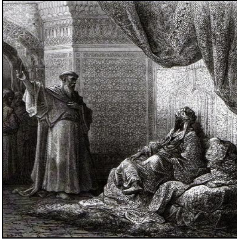
Gustave Doré Saint François et le sultan

Pour conclure notre rapide panorama, intéressons-nous à présent à la gravure de Gustave Doré figurant dans l'Histoire des Croisades de Joseph-François Michaud (1877) qui nous présente pour la première fois un point de vue différent : Saint François dominant le sultan 13 . Dans la représentation donnée par l'artiste, la passivité et l'indolence du sultan contrastent avec l'autorité et la confiance qui émanent de François. Dans ce sens, le saint, par son attitude, incarne les valeurs de l'Europe dans un contexte historique précis : le XIX e siècle colonisateur. Selon cette grille de lecture, le voyage de François en Orient devient synonyme de « mission civilisatrice ». La rencontre historique de Damiette est exposée sous un angle novateur. Jusqu'alors le sultan était représenté dans une position dominante, mais au XIX e siècle la situation s'inverse : François surplombe un sultan assis. La représentation de cette scène paraît évoluer en fonction du discours politique et des préoccupations temporelles de l'Église en Occident.