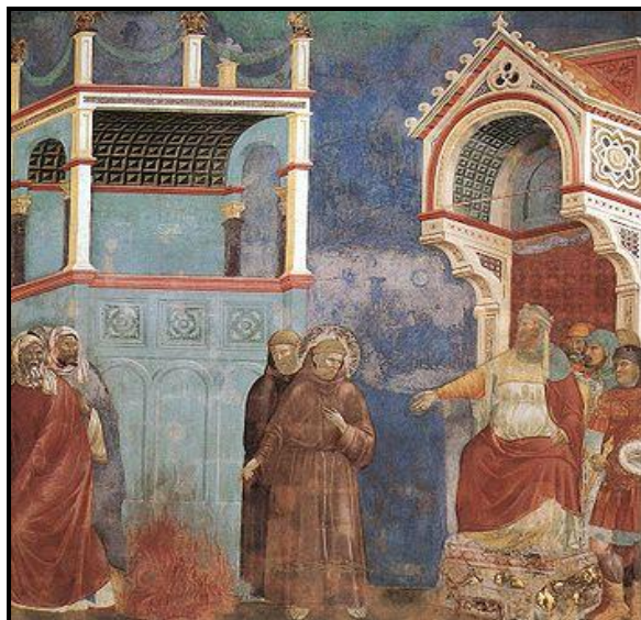
Giotto Bondone Épreuve du Feu

Une cinquantaine d'années plus tard environ, vingt-huit fresques réalisées pour la basilique d'Assise et attribuées à Giotto Bondone (vers 1267-1337) retracent la vie et les miracles de Saint François. Les scènes s'appuient presque toutes sur le récit de la Legenda Maior (vers 1260) fourni par Bonaventure, ministre général de l'ordre franciscain qui deviendra d'ailleurs la biographie officielle du saint. On note qu'ici, l'épisode se voit enrichi de l'épreuve du feu : « Si tu veux te convertir au Christ, et ton peuple avec toi, c'est très volontiers que, pour son amour, je resterai parmi vous. Si tu hésites à quitter la foi du Christ pour la loi de Mahomet, ordonne qu'on allume un immense brasier où j'entrerai avec tes prêtres, et tu sauras alors quelle est la plus certaine et la plus sainte des croyances, celle que tu dois tenir » 9 . Saint François est placé au milieu de la composition, devant un feu qui le sépare des sarrasins. Il jette un regard au sultan qui l'exhorte de la main à entrer dans le bûcher. Dans ce cas, la mission de François en Égypte évolue en une confrontation teintée de dramatique et met l'accent à la fois sur la supériorité du christianisme et sur la témérité de François.