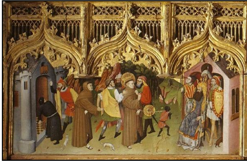
Nicolàs Francès Retable de la Bañeza