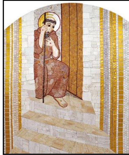
Atelier Rupnik Saint François à Mont Saint Michel

Cet épisode, fruit d'une invention, met en avant une vision militante puisque pour affronter le Mal, Padre Pio reçoit une arme de guerre de la main même du chef de la milice divine qui combat pour Dieu et triomphe de Lucifer. Cette grille de lecture permet de rappeler que Saint Michel est avant tout un saint guerrier qui, au XVII e siècle, sous l'influence de la Contre-réforme, voit son culte prendre un nouvel essor et symbolise le triomphe de l'Église catholique sur l'Église protestante. Cette représentation qui confronte l'entretien de Saint François et de Saint Michel apparaît paradoxale puisque Padre Pio s'apparente à un paladin alors que Saint François était surtout l'apôtre de la non-violence.