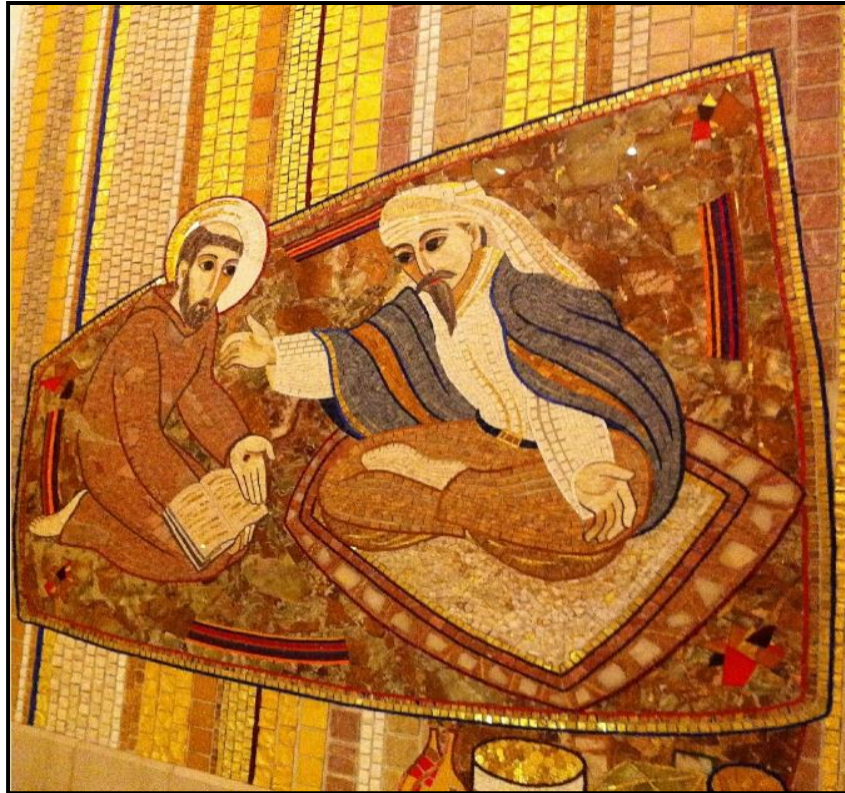
Atelier Rupnik Saint François annonce l'Évangile au sultan

Revenons à présent à la mosaïque de Rupnik qui se trouve dans la basilique inférieure de San Giovanni Rotondo. La composition est plutôt inédite en ce sens qu'elle présente François et le sultan, assis sur un tapis richement orné. Ils tiennent un paisible conciliabule. Le sultan, enthousiaste, est incliné vers Saint François et esquisse un geste de bienveillance en lui indiquant les offrandes qu'il voudrait que le saint accepte. François, quant à lui, fait un geste similaire à celui de la Vierge à l'Épiphanie quand, à l'arrivée des mages, elle offre l'Enfant Jésus. Le mosaïste, à travers une vision pacifiste, encourage la dévotion au saint. Par conséquent, cette séquence évacue l'hostilité qui était jusque-là de mise entre les deux hommes et propose une place privilégiée au dialogue.