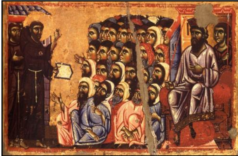
Coppo di Marcovaldo Retable Bardi

Évoquons, en premier lieu, le retable qui se trouve dans l'église de la Santa Croce à Florence et qui fut réalisé par le peintre italien Coppo di Marcovaldo (vers 1225-1274) pour la famille Bardi, une famille florentine influente. Saint François se trouve sur la huche du retable et les vingt scènes qui l'entourent relatent ses principaux miracles. Sur le volet gauche, une scène évoque son entrevue avec le sultan. On note la présence du saint, l'Évangile à la main. Il précède deux frères et s'adresse à une foule de personnages barbus orientaux qui semblent écouter doctement les mérites du christianisme. Sur le bord droit de la scène, le sultan, hiératique paraît captivé par le discours de Saint François. L'artiste parvient à circonstancier la mission que le Christ avait prescrite aux apôtres : porter la bonne nouvelle par la prédication aux infidèles.