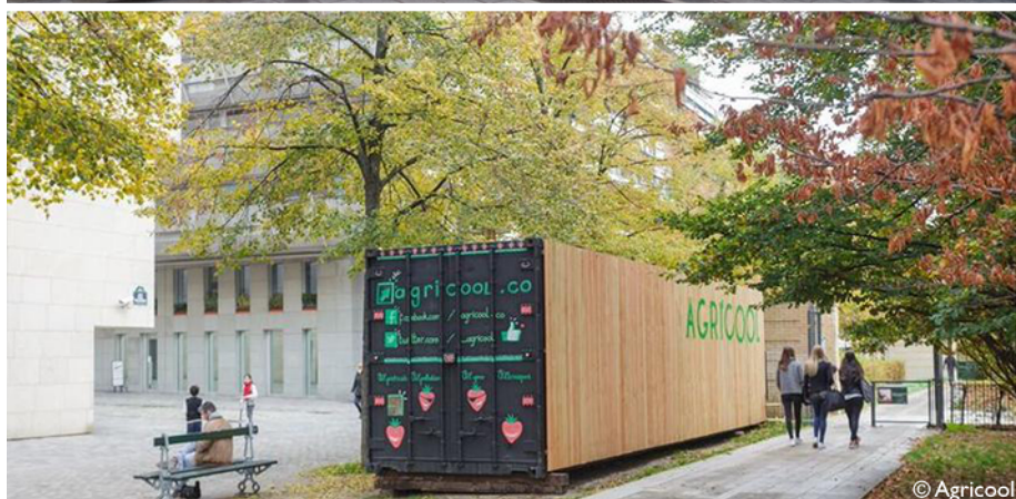
1. En haut, La Caverne, projet lauréat de Parisculpteurs pour une champignonnière dans un parking du 18 ème arrondissement ( Parisculpteurs ). Au milieu, le jardin mobile de l'esplanade Nathalie Sarraute à Paris (photographie S. Courthéoux, 2015). En bas, culture de fraises dans un conteneur au parc de Bercy à Paris (Agricoool).